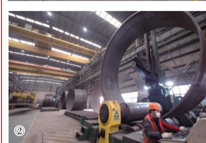
近年来,我县聚焦项目强县、聚力开放创新,大力推进海上风电为主导的新能源产业集聚,高标准规划建设国际海上风电新城和风电装备产业基地,全力打造千亿级海上风电产业基地。