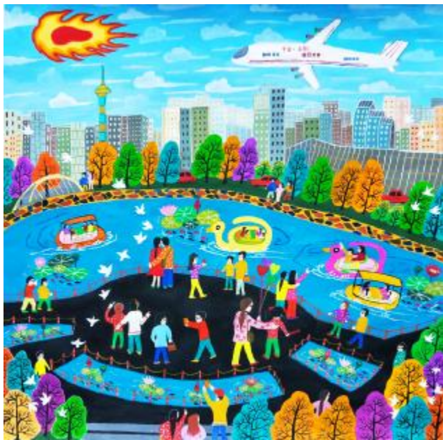
《聚龙湖畔春光美》 葛春芳