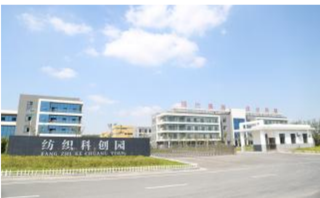
纺织科技园项目总投资 5 亿元, 致力打造以纺织研发创新为核心、文化创意和贸易服务为两翼的“一体两翼”创新发展平台。