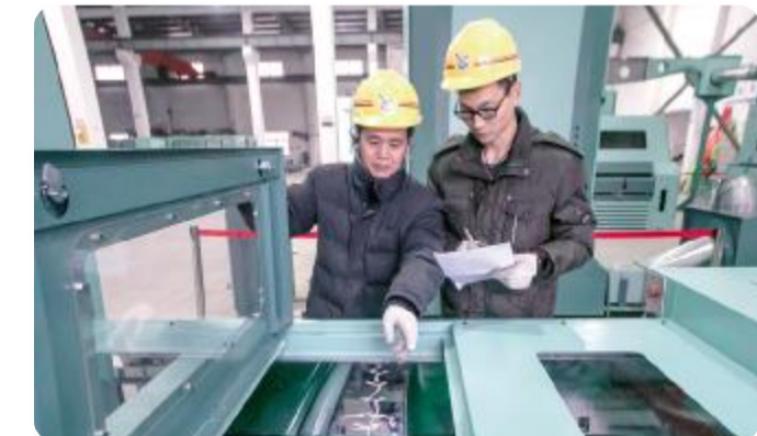
拥有 30 多项国家发明专利的金大纺织机械制造有限公司