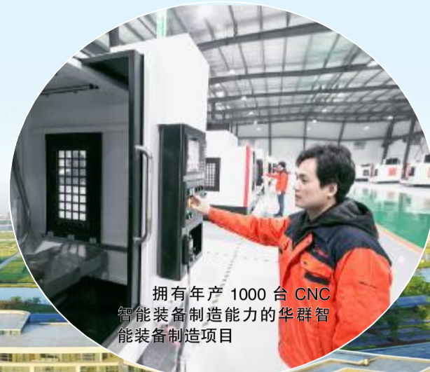
拥有年产 1000 台 CNC 智能装备制造能力的华群智能装备制造项目