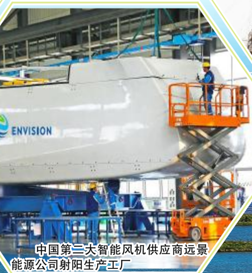
中国第三大智能风机供应商远景能源公司射阳生产工厂