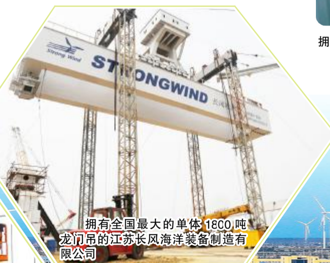
拥有全国最大的单体 1800 吨龙门吊的江苏长风海洋装备制造有限公司