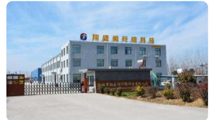
中国摩擦密封材料协会会员单位——盐城翔盛碳纤维科技有限公司