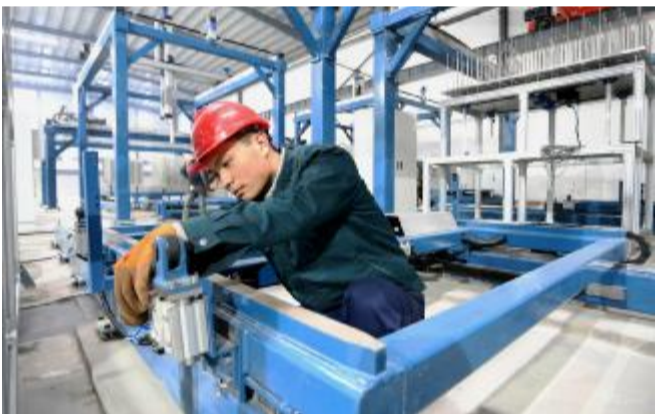
康平纳智能染整项目计划总投资 15 亿元, 可年产纱线染色及针织物 8 万吨, 实现营业收入 30 亿元、利税 3 亿元。