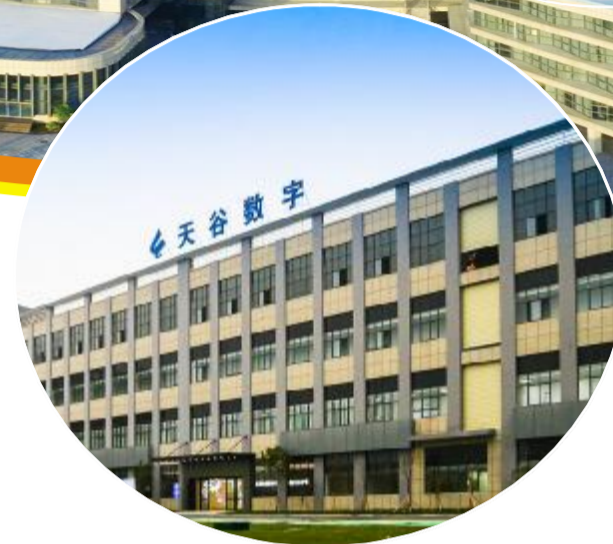
总投资 10 亿元的天谷数字太赫兹通信设备项目