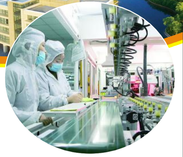
我县首家在新三板挂牌上市的企业——江苏易电通智慧能源股份有限公司