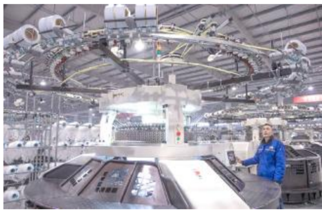
江苏题桥纺织印染有限公司全年计划生产 12000 吨色线和高档功能性面料。