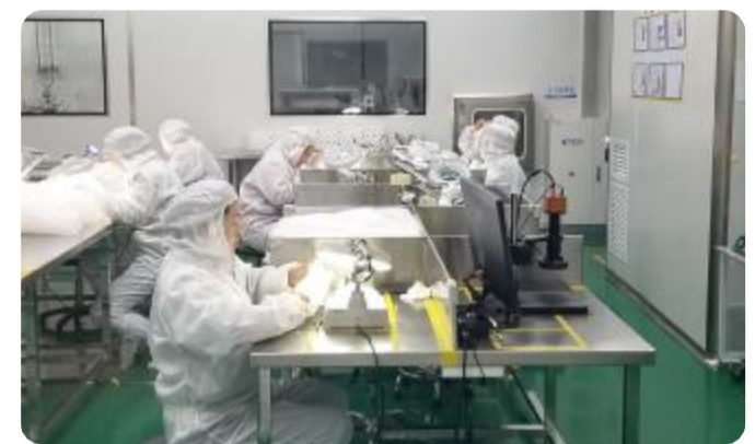
国家高新技术企业——江苏明科精密橡塑科技有限公司

规划总面积 12.7 平方公里, 大力发展机械装备、电子信息等主导产业, 积极争创省级科技园区。