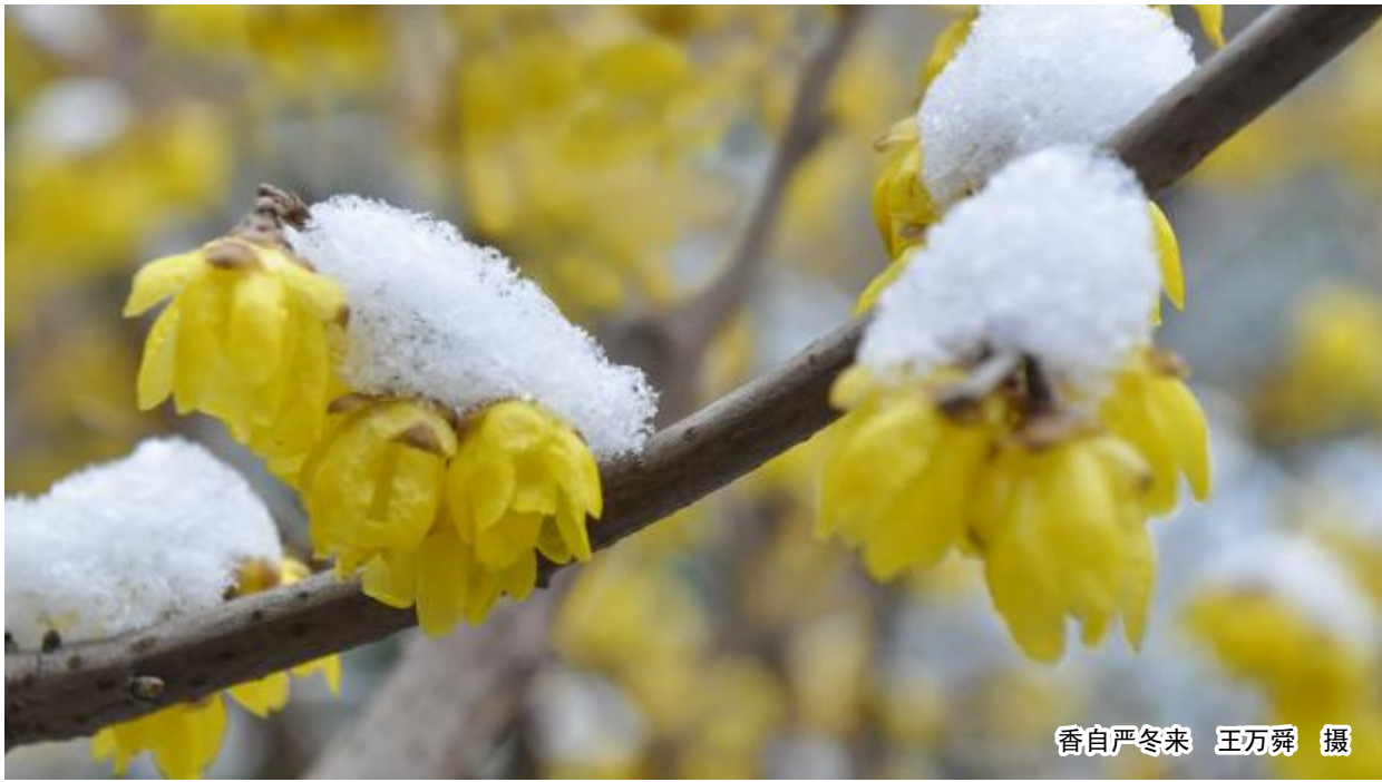
香自严冬来