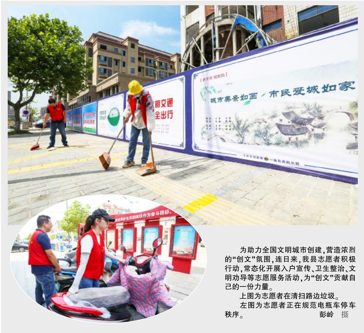
为助力全国文明城市创建,营造强烈的“创文”氛围,连日来,我县志愿者积极行动,常态化开展入户宣传、卫生整治、文明劝导等志愿服务,为“创文”贡献自己的一份力量。 上图志愿者在清扫路边垃圾。 左图为志愿者正在规范电瓶车停放秩序。

做好疫情防控。同唱一首“歌”。在新冠肺炎疫情防控期间,该支行按照总行党委的安排部署,把抓好疫情防控作为首要任务、头等大事,第一时间在营业部门外配置警戒线,划好登记区域,在门口安排双人登记、三人维持,门内配置口罩、手套和消毒器具,每日坚持对营业场所进行消毒;在休工期间,该支行安排三人值班,并对取款机具及时加钞,确保自助设备正常使用;积极主动服务复工复产,及时安全地满足农村群众金融需求,为小微企业、医务工作者和急需用钱的经营农户“送货”,主动联系上门服务,用线上手段帮助解决资金困难。截至目前,该支行已累计发放复工复产贷款500多万元。