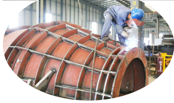
宝松重工位于洋马镇的海上宝松盐城重型机械有限公司是一家主要生产200吨(含)以上各种吨位起重机械、龙门、铸造起重机的国家高新技术企业,目前正在组织工人加班加点赶制武钢集团、宝钢集团配套产品,在手订单已经排到年底。图为该公司生产场景。