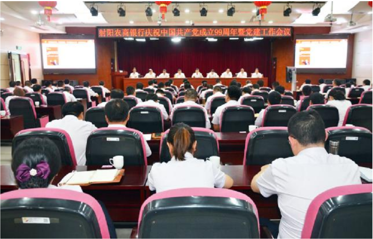
日前，射阳农商银行党委在四楼第一会议室举行一堂党课、支部工作条例培训等活动，号召全体党员转变工作作风，充分发挥党员的先锋模范作用，自觉践行党的宗旨，带头深入基层、深入群众，解难题、攻难关，以实际行动践行初心和使命。图为活动现场。