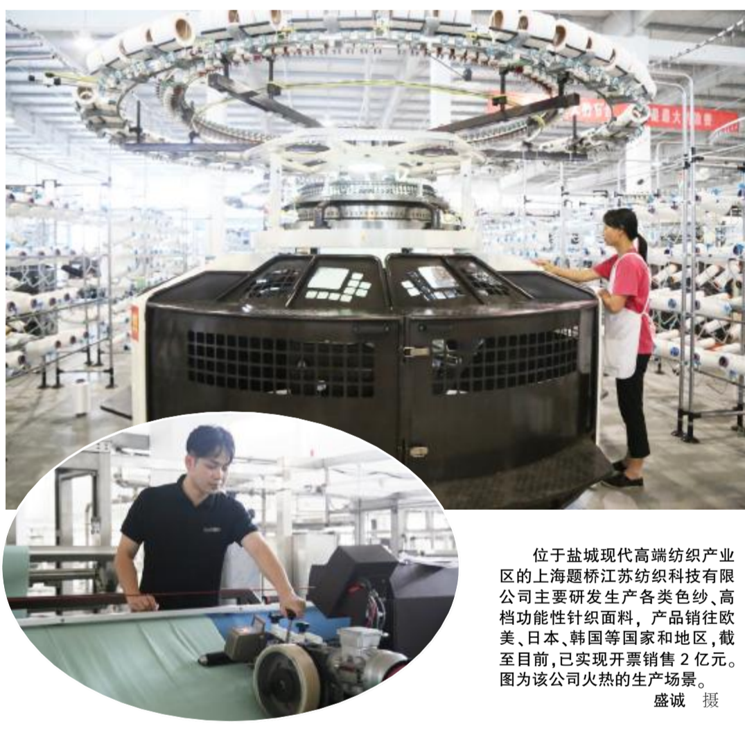
位于盐城现代高端纺织产业区的上海耀桥江苏纺织科技有限公司主要研发生产各类色纱、高档功能性针织面料,产品销往欧美、日本、韩国等国家和地区,截至目前,已实现开票销售2亿元。图为该公司火热的生产场景。