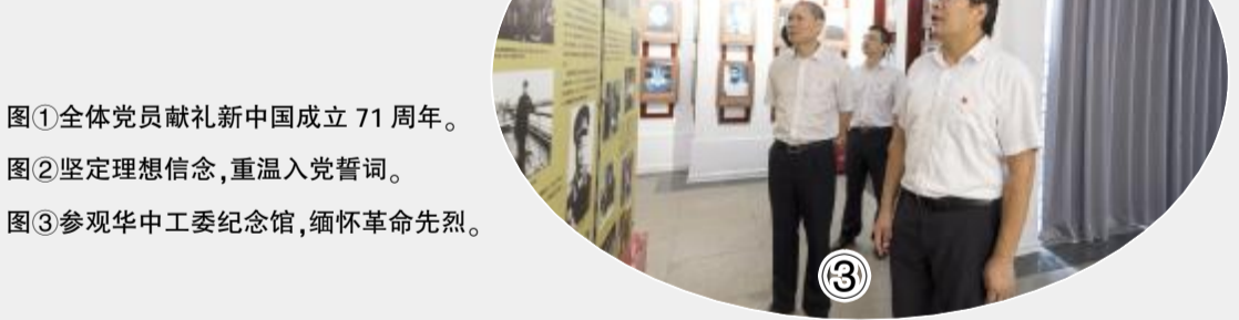
图①全体党员献礼新中国成立71周年。