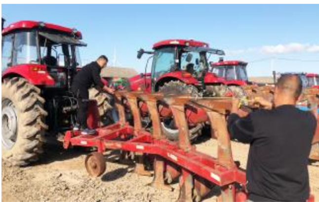
为提升农机机械化对农业的服务本领，10月11日上午，淮海农场农机服务中心组织农机技术管理人员，对农机状况进行检查，确保今年“三秋”工作顺利进行。图为检查人员在测量翻耕犁的犁距是否合规。

徐锦文手捧鲜花和证书激动地说：“感谢家乡父老乡亲给了我这么高的荣誉，以后我不管走到哪里，永远不会忘记祖国，永远不会忘记家乡海河镇的养育之恩。我将再接再厉，为伟大的祖国争光，为家乡海河人民争光，祝愿家乡海河更加文明富庶！”