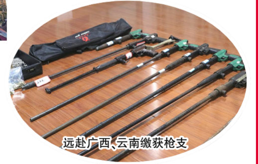
远赴广西、云南缴获枪支

回望, 是为了更好地前行。2021 年, 县公安局将以学习贯彻党的十九届五中全会精神为契机, 紧扣国民经济和社会发展“十四五”规划, 围绕中央、省市决策部署, 在县委、县政府和市公安局的领导下, 以升级现代治安防控体系为基石, 有力维护政治安全、社会安定、人民安宁, 不断促进经济社会持续健康发展。