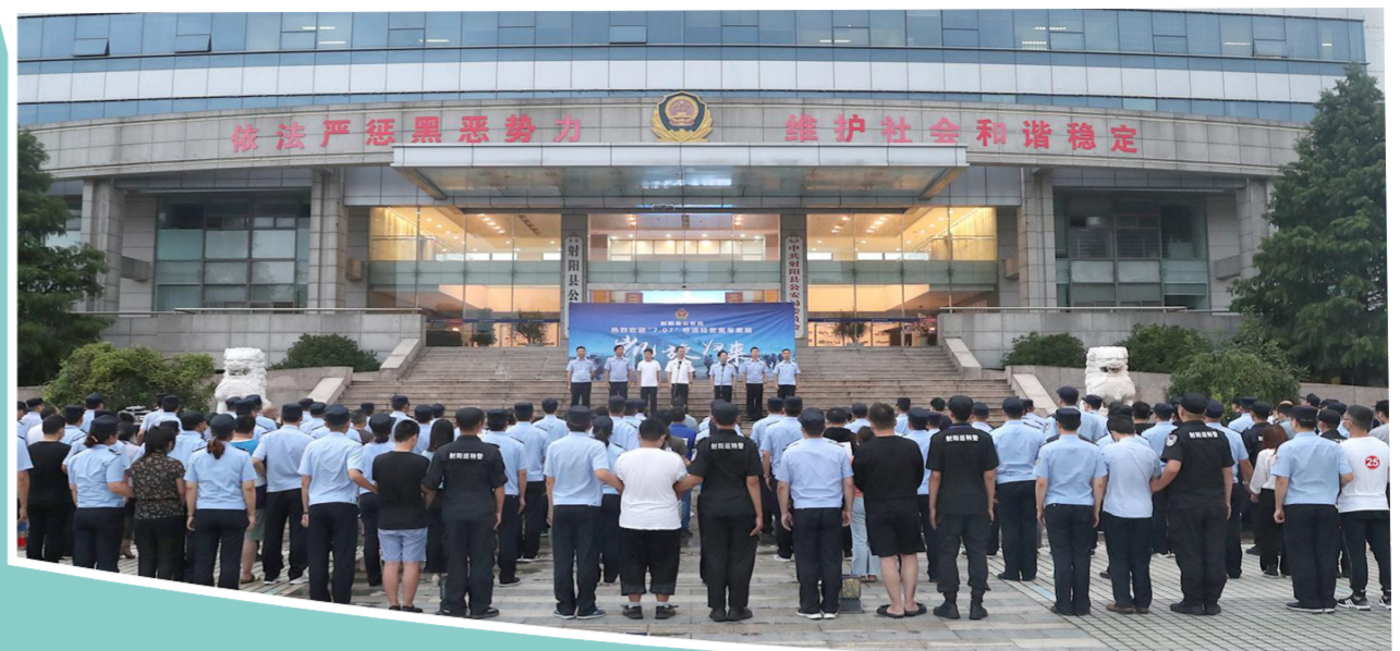
破获“7.07”特大网络非法经营案

平安稳定的社会环境是发展之需、人民之福。2020年, 县公安机关和广大公安民警面对新时代给出的新“考题”, 在市公安局和县委、县政府的坚强领导下, 统筹推进疫情防控和主责主业, 紧紧围绕“一体、两翼、三大支撑、四轮驱动”工作布局和“五个三”总体规划, 深化推进现代警务体系建设, 用顽强拼搏、扎实苦干的努力和奋斗, 为射阳高质量发展贡献了“公安力量”, 向党和人民交上了一份优异答卷。