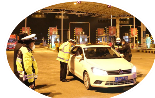
设立检查点严防外部输入