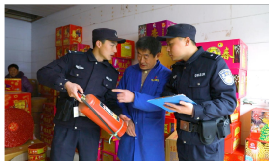
狠抓消防隐患清零行动