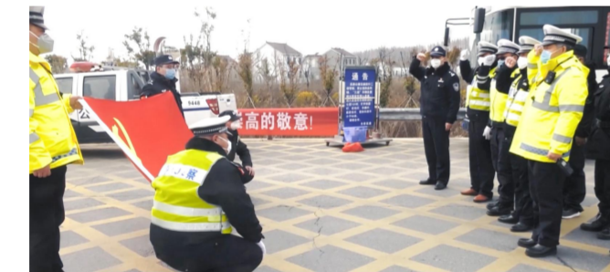
落实战时思想工作机制

夯实群众生命安全和身体健康“第一道防线”, 更要筑牢安保维稳坚实防线。2020 年, 县公安局深化“战时+常态”安保维稳机制, 圆满完成党的十九届五中全会、全国各级“两会”省委主要领导来射调研、全市高质量发展现场观摩等重大活动安保任务, 确保了敏感时间节点平稳过渡, 帮助化解涉及医疗物资的重大合同纠纷, 有力保障了太阳城工区河消防隐患集中整治、黄沙河违规用海集中整治工作顺利推进。