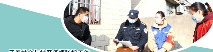
开展社会与社区疫情防控工作