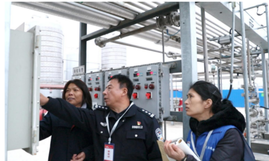
开展小化工专项整治