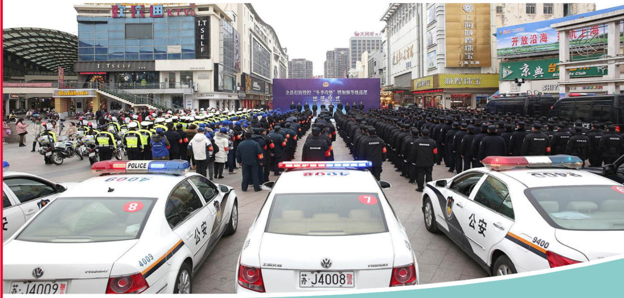
维护政治安全、社会安定、人民安宁