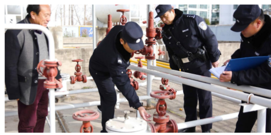
强化危化品安全监管

在市公安局组织的临控测试和全市 110 接处警“关城门”两项考核中, 我县网吧、宾馆预警, 320 抓拍率、人像识别精准度测试结果优秀, 利用感知系统和前端作战单元实施车辆比对、轨迹分析、卡点布控、围堵抓捕等实战效能明显。由县公安局研发的执勤执法模型《交通事故高发与巡逻路径关联分析》在公安部、省公安厅交警“大数据建模比武竞赛”中获评优秀模型, 全国唯一县级公安机关优胜奖。