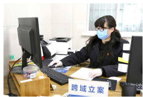
网上立案解民忧,防疫期间“不打烊”

2020年,射阳法院在县委的坚强领导下,在社会各界的大力支持下,坚持以习近平法治思想为指导,以“努力让人民群众在每一个司法案件中感受到公平正义”为目标,认真贯彻党的十九大和十九届二中、三中、四中全会精神以及省、市、县委工作部署,聚焦服务保障疫情防控和社会经济发展“双胜利”,聚力做好“六稳”工作,落实“六保”任务,精准服务高质量发展。