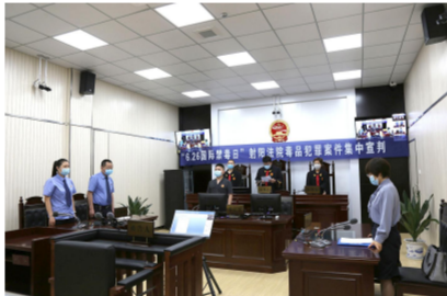
毒品犯罪案件集中宣判