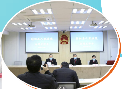
召开消费者权益保护新闻发布会

优化司法便民利民服务,找准人民法院参与社会治理的立足点和结合点,积极助力县域社会治理现代化。主动与社区对接,组建法院志愿者队伍深入一线参与防控,向社区捐赠消毒液等防疫物资,向居家隔离群众捐赠粮油等生活物资。科级干部下沉挂钩企业,有序推进企业复工复产,组织干警参加无偿献血活动,彰显法院人的初心和本色。加快推进一站式多元解纷机制和诉讼服务体系,主动回应人民群众不断增长的司法需求,拓宽人民群众维护合法权益的渠道。创新便民服务模式,满足当事人足不出户司法新期待。深入社区乡村、学校企业开庭审理案件,把法庭搬到村部、厂部、田头、码头,融庭审和宣教为一体,让旁听人员参与调解,做到审理一案教育一片。全年巡回审理80余场次,观摩群众1300余人。开展“审判三进”“干警进网格”“让民法典走进千家万户”系列活动,将系列“法治套餐”送进机关、社区、校园,送进广大群众心里。开展法治大讲堂、法治赶集等活动100余场次,接受法治宣讲人数2万余人。