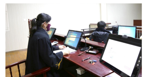
疫情期间视频开庭审理案件