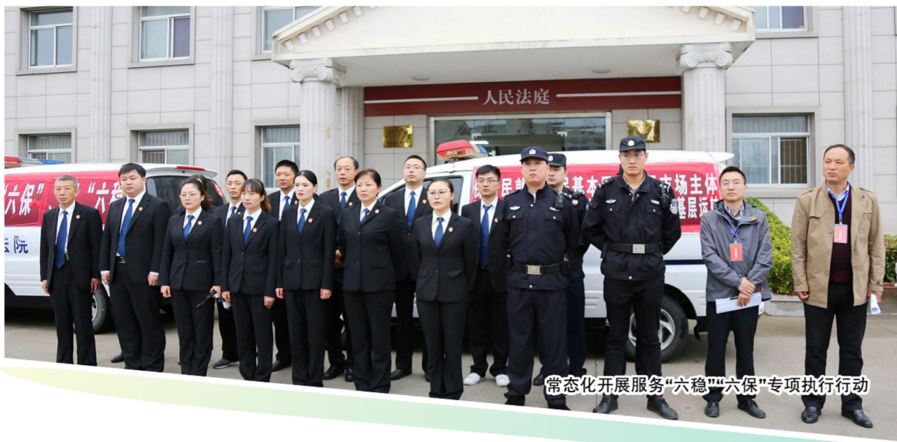
常态化开展服务“六稳”“六保”专项执行行动