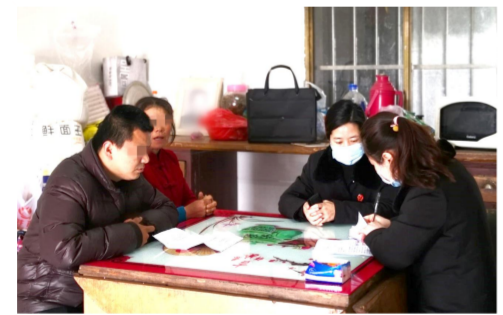
上门立案打通司法服务“最后一公里”