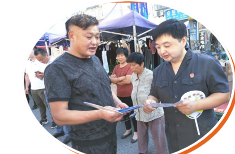
法官走上街头开展普法宣传

在新的一年里,射阳法院将以更加昂扬的精神状态,更加坚定的使命担当,更加务实的工作举措,与百万人民勠力同心,为书写“争当表率、争做示范、走在前列”新时代射阳答卷提供坚强保障。