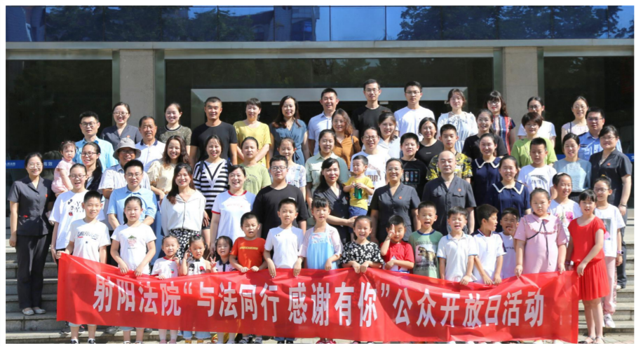
开展以“与法同行,感谢有你”为主题的干警家属开放日活动