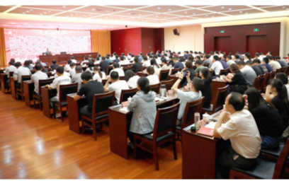
院领导受邀为县纪委监委作《民法典》专题讲座