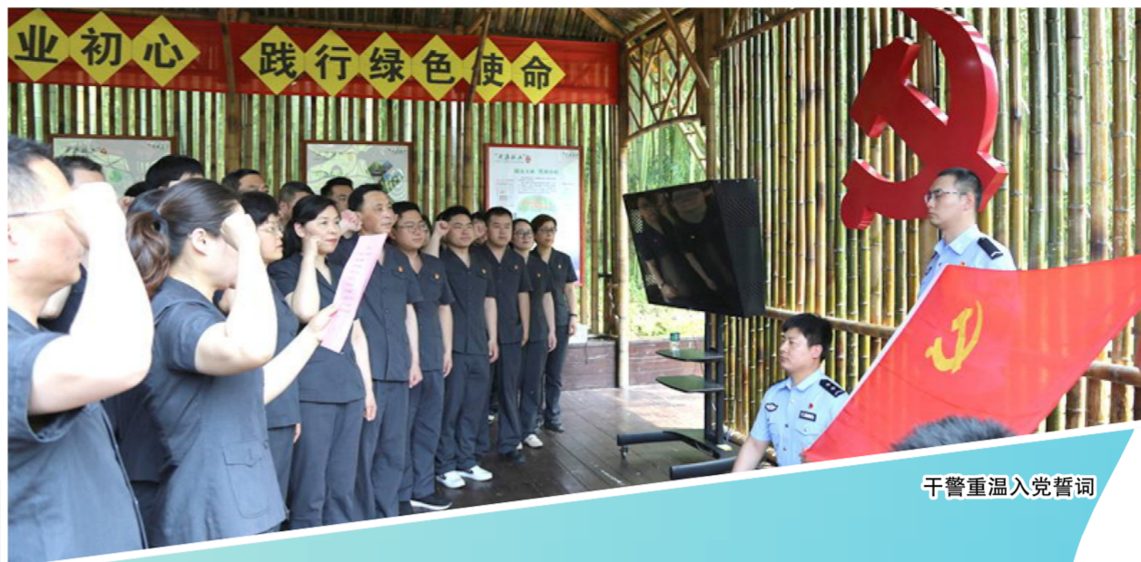
干警重温入党誓词