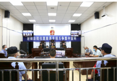
开展扫黑除恶专项斗争集中宣判活动