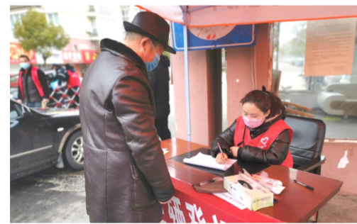
干警深入社区,协助开展疫情防控工作