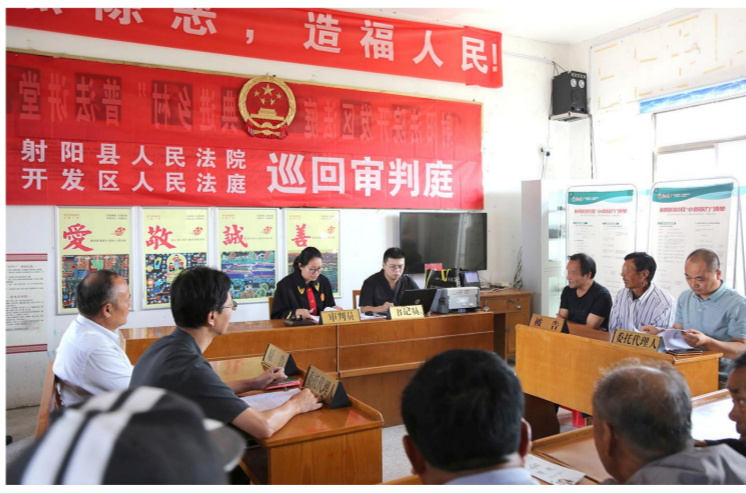
开发区法庭巡回审理一起房屋所有权确认纠纷案件