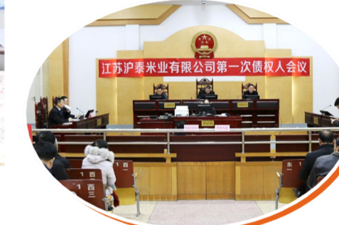
召开江苏沪泰米业有限公司第一次债权人会议