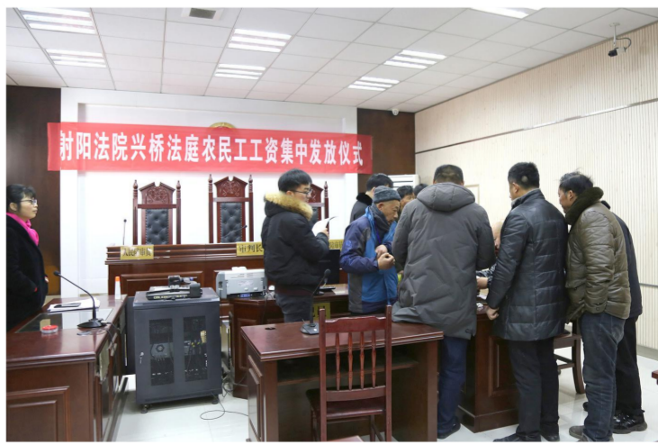
春节前集中发放农民工工资