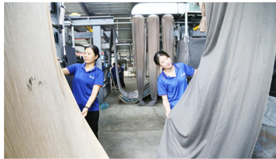
江苏欧斯曼纺织科技有限公司