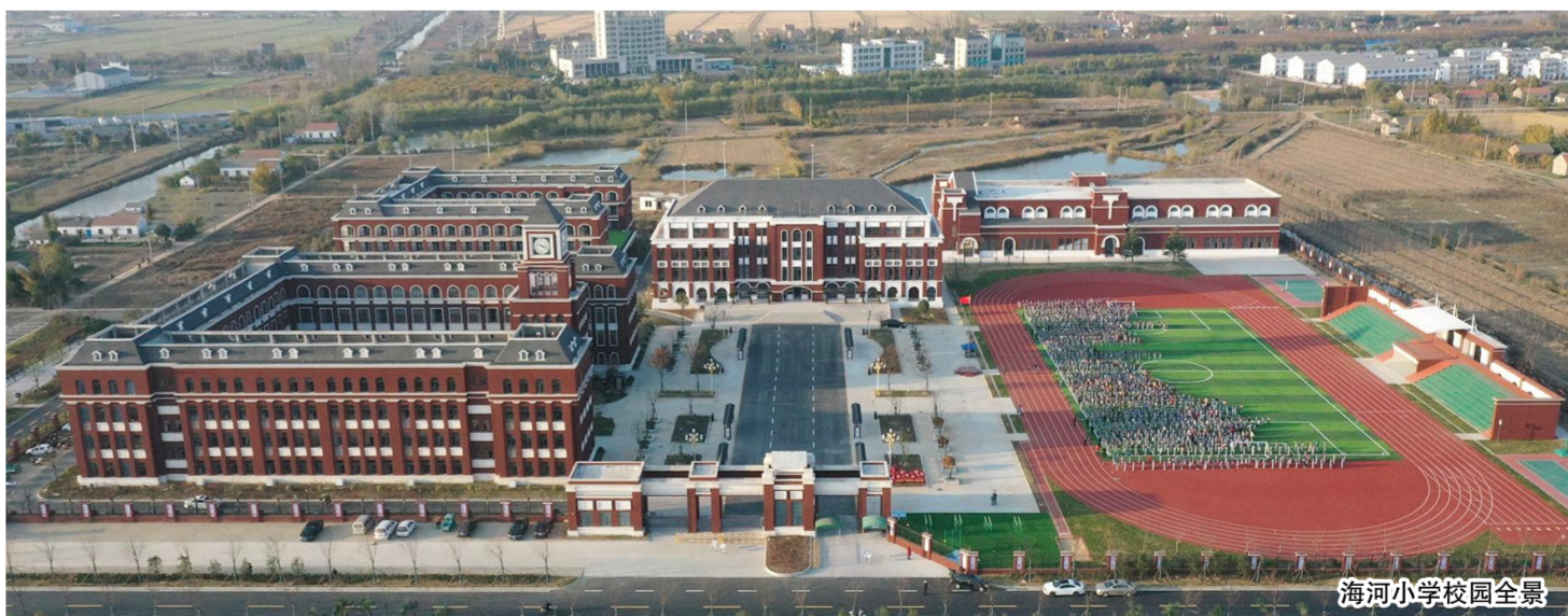
海河小学校园全景

全县各学校按照部署要求,将内涵建设作为“一把手”工程,实行“一把手”负责制,建设好物质文化、制度文化、课程文化,做实德育活动。把特色建设与教育改革、校本课程开发、学校传统办学优势等结合起来,从整体和全局上进行长期规划。持续深入推进“双创一争”主题教育活动,大力实施乡村教师领航、农村校长助力等一系列工程。围绕“推进内涵发展,提升教育质量”这一主题,对全体教师开展专题培训,邀请南京、海门、盐城等一批名校专家赴射讲座指导,使广大教师触摸一流学校的发展脉搏,树立内涵建设的理念,增强内涵建设责任,提高内涵建设能力。把课题研究作为内涵建设的助推器,全县层面的课题研究坚持系统化,体现全局指导作用;学校层面的课题研究坚持专题化,体现具体实用性。学校规范管理、教学科研、队伍建设、学生发展、特色建设等内涵发展要素得到有效彰显,基本形成点上开花、面上结果的良好格局,一批内涵建设示范校、样板校应运而生。