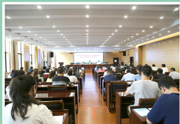
信息技术教师专题培训