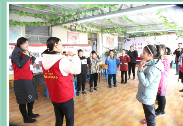
县教育系统新时代文明实践助学支教志愿者开展农村留守儿童关爱活动