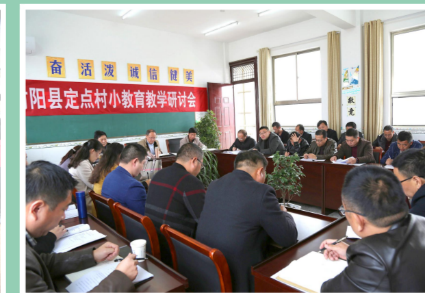
农村学校教育教学研讨活动