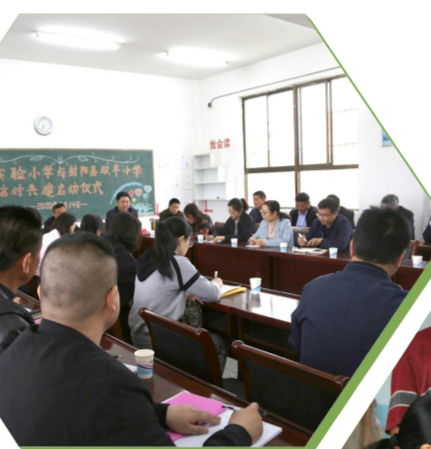
特殊教育学校教师送教上门