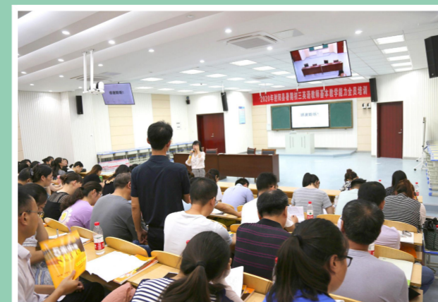
县初三教师教学技能全员培训