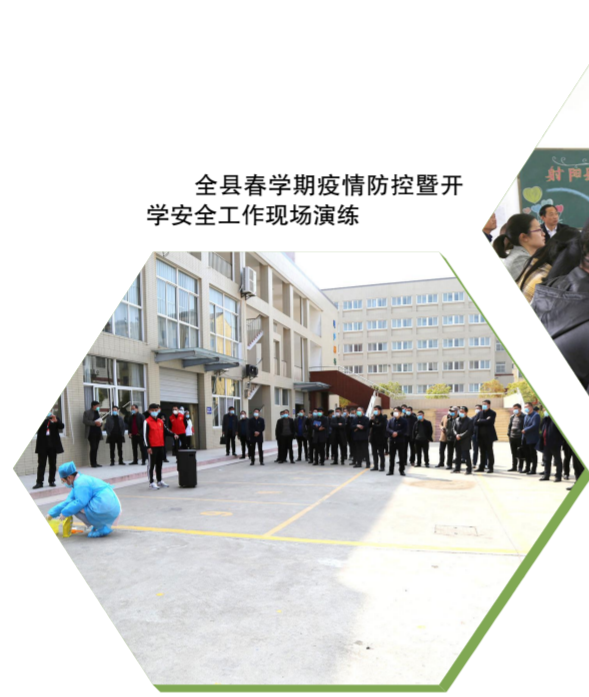
全县春学期疫情防控暨开学安全工作现场演练