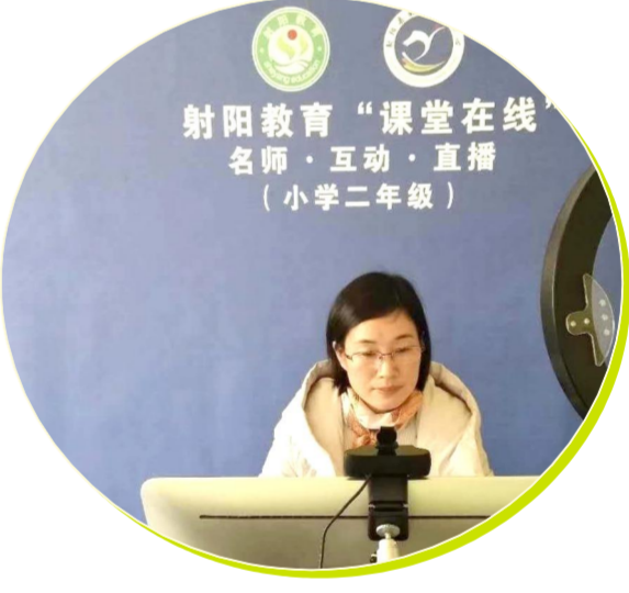
疫情期间线上教学直播

坚持扶贫与扶智、扶贫与扶志相结合,积极开展理想信念、传统美德、阳光健身和文明礼仪教育,对活动进行整体系统设计,形成一套立足学生、为了学生、发展学生的活动体系,将活动规范要求内化为学生的习惯,内化为学生对品质生活的追求与向往,以此发展学生能力,提升学生素养。把提高教学质量作为教育扶贫的重要抓手,以品质课堂为标准,以学生能力发展为重点,采用“基础性课程+个性化课程”的方式,构建“以生为本”“以学为本”课堂,积极开展“因时而学、因学生问、以问促学、学练结合”的“同学课堂”建设,为学生提供优质课程服务,86 名贫困学子实现跨入高等学府深造的夙愿,1500 多名师生在市级以上各类基本功和学科竞赛展示中摘金夺银。