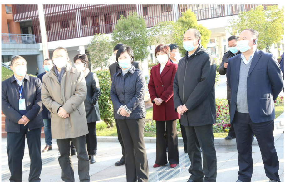
省农村义务教育保障水平提升工作现场会场景