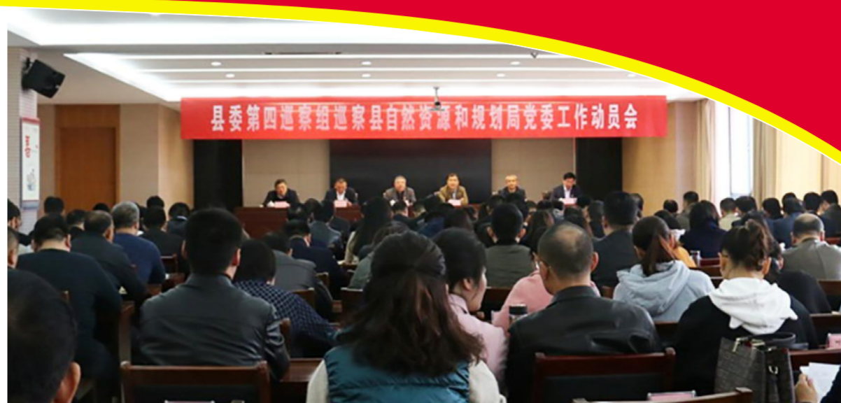
县委巡查县自然资源和规划局党委工作动员会