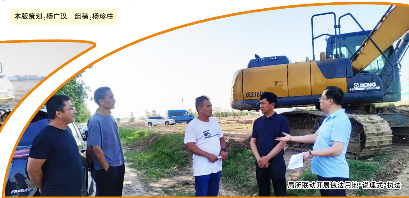
局所联动开展违法用地“说理式”执法