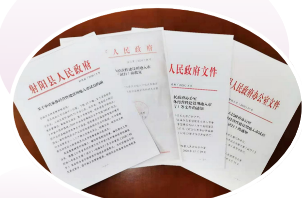
农村集体经营性建设用地入市试点成功实施