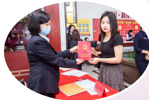
创新开启“交房即发证”服务模式