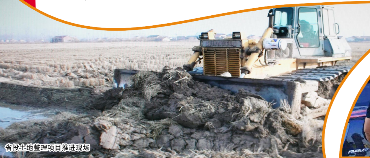
省投土地整理项目推进现场