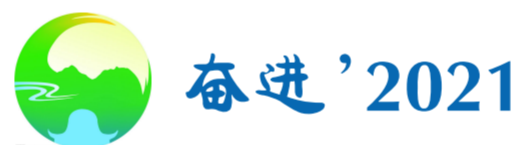
获评江苏省自然资源系统先进基层党组织

坚持以习近平新时代中国特色社会主义思想为指导,全面贯彻党的十九大、十九届历次全会、中央经济工作会议和省市县委全会精神,深入贯彻落实习近平总书记视察江苏重要讲话指示精神,把握新发展阶段,坚持新发展理念,融入新发展格局,坚决贯彻“争当表率、争做示范、走在前列”重大要求,以党建为统领,围绕“两统一”核心职责和高质量发展要求,持续推进自然资源治理体系和治理能力现代化,着力抓好六项重点工作,确保“十四五”开好局、全面建设社会主义现代化起好步,以优异成绩庆祝建党 100 周年。