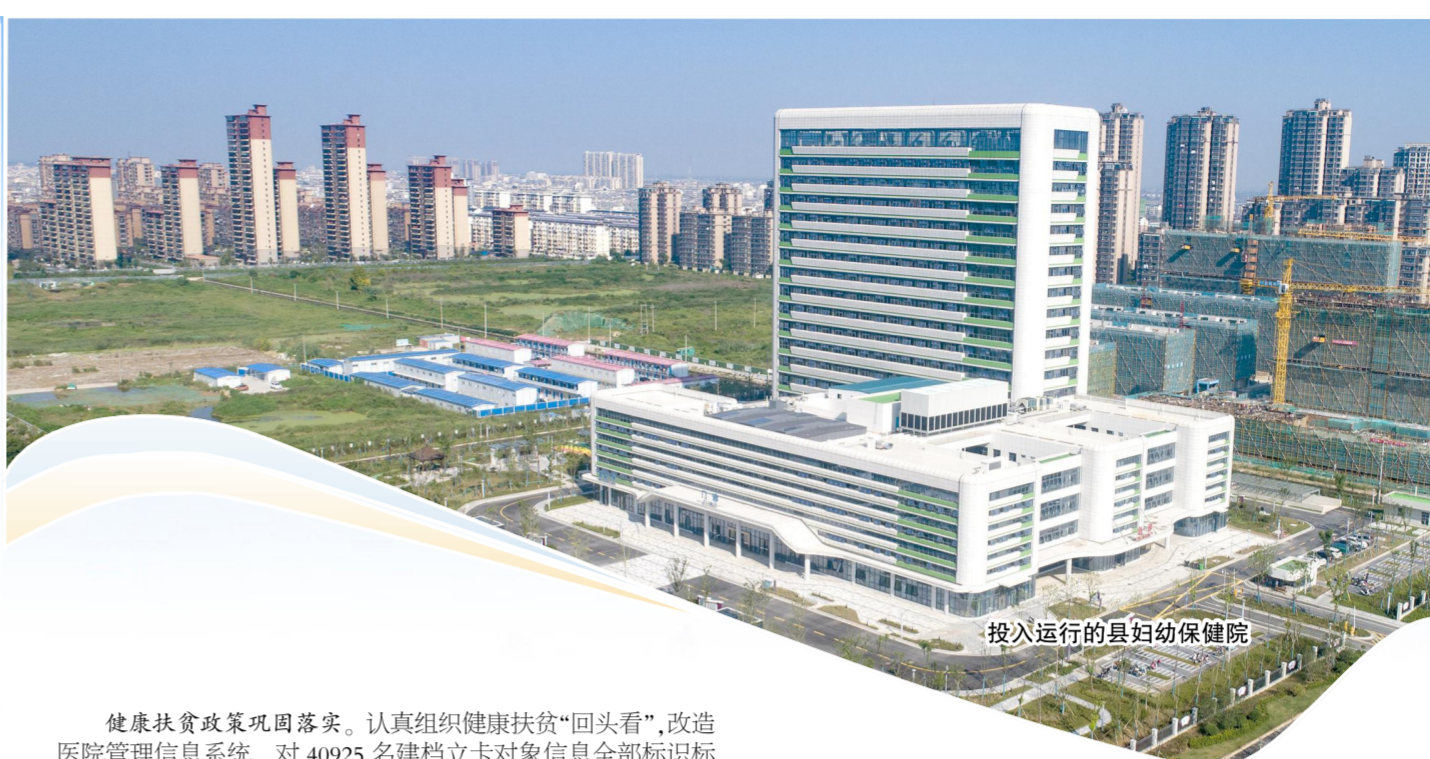
投入运行的县妇幼保健院

2020年,我县卫生健康工作在县委县政府的坚强领导和上级部门精心指导下,统筹推进新冠肺炎疫情防控和卫生健康改革发展工作,做到两手抓、两不误,各项工作均得到有效落实。新冠肺炎疫情保持“零发病、零感染、零输入”,县妇幼保健院投入运行,县人民医院新院区即将建成运行,基本公共卫生服务项目考评位居全省前列,国家卫生县城顺利通过复评。