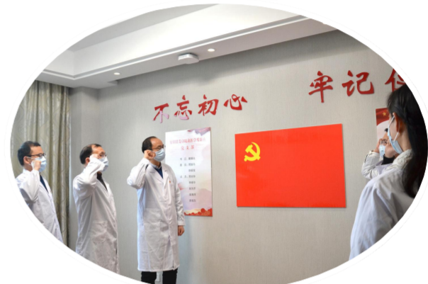
2020年初,我县集中医学观察点医务人员重新入党誓词