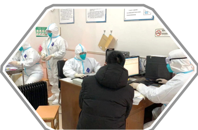
县人民医院发热门诊医务人员正在为发热病人进行预检分诊

统筹做好人才引进培养。简化优化人才招录程序,全年组织人才招聘3场,招录卫生人才68人。县妇幼保健院公开选调21人。新增完成定向医学培养85人,定向委培毕业生就业安排17人,常住人口执业(助理)医师数达到2.63人。全组织卫生高级职称申报评审184人,遴选省级基层卫生骨干人才35人。15名援鄂人员慰问金等待遇关爱政策全面落实。