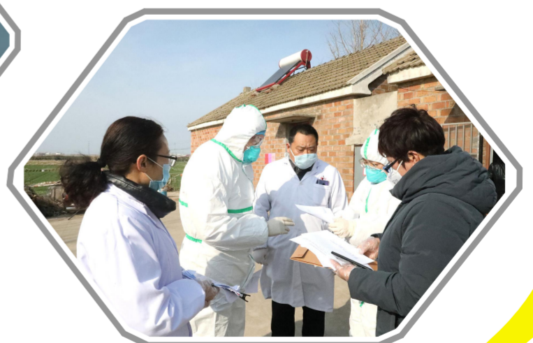
医卫人员入户流调

◆持续深化综合医改工作。科学编制卫生健康“十四五”发展规划,扎实开展公立医院综合改革,基层人才队伍和家庭医生签约服务建设,聚力争取省政府真抓实干成效明显奖项。认真开展接轨上海,新建名医工作室5个,加强与上海复旦大学合作,有效运行儿童早教中心。大力组织“互联网+医疗”务实应用工作,提高群众就医体验。加强市县医联体、县域医共体建设,县域内就诊率稳定在90%左右。扎实开展综合监管,打造平安医院。