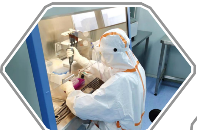
公卫人员在县疾控中心核酸检测实验室做实验