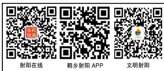
射阳在线 鹤乡射阳APP 文明射阳

近年来,我县大力推行工程建设审批领域“四即”改革,在全省成功试点“交房即发证”的基础上,在全市率先常态实现“拿地即开工”“交房即发证”“交地即发证”“发证即办抵押”改革,2020年办理的一批“拿地即开工”项目,办理周期由原来的3个月缩短至40个工作日内,审批时限由原来的50个工作日压缩在3个工作日内;不动产登记证书、不动产抵押登记证明、住宅使用说明书、住宅质量保证书以及自来水、电力、天然气、电信网络开户8本证书证明实现同步办理。