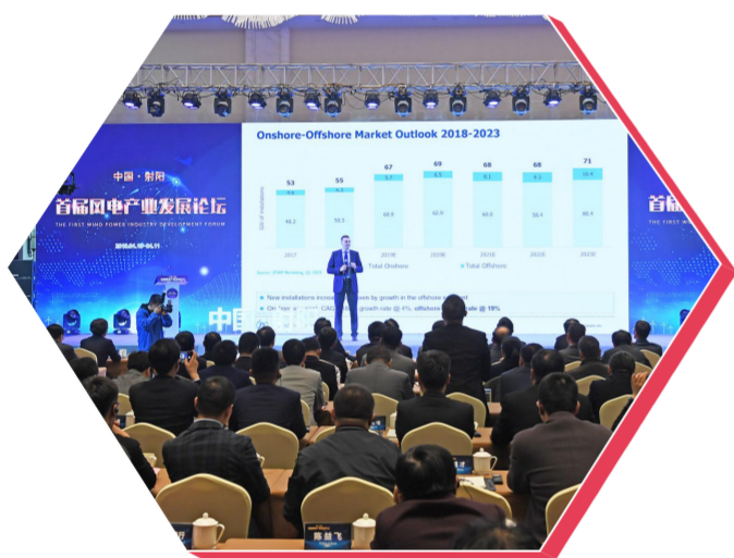
首届风电产业发展论坛