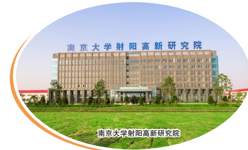
南京大学射阳高新研究院