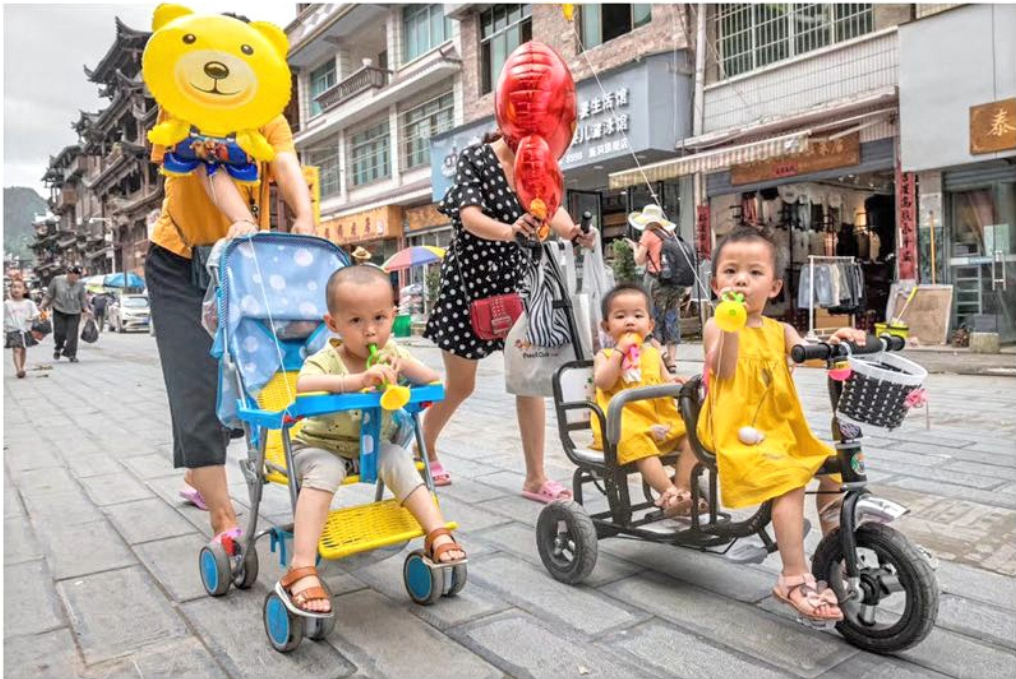
快拍身边人: 婴儿车队