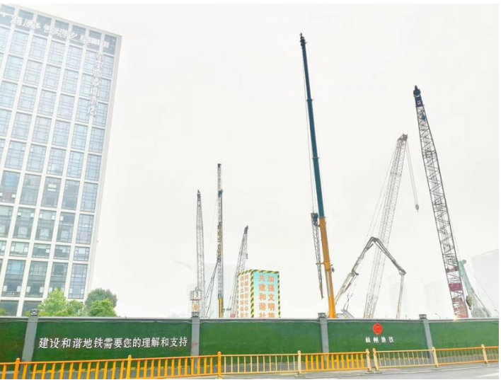
快拍快拍: 遗漏的风景