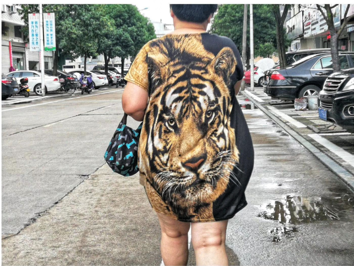
快拍身边人: 背后有虎