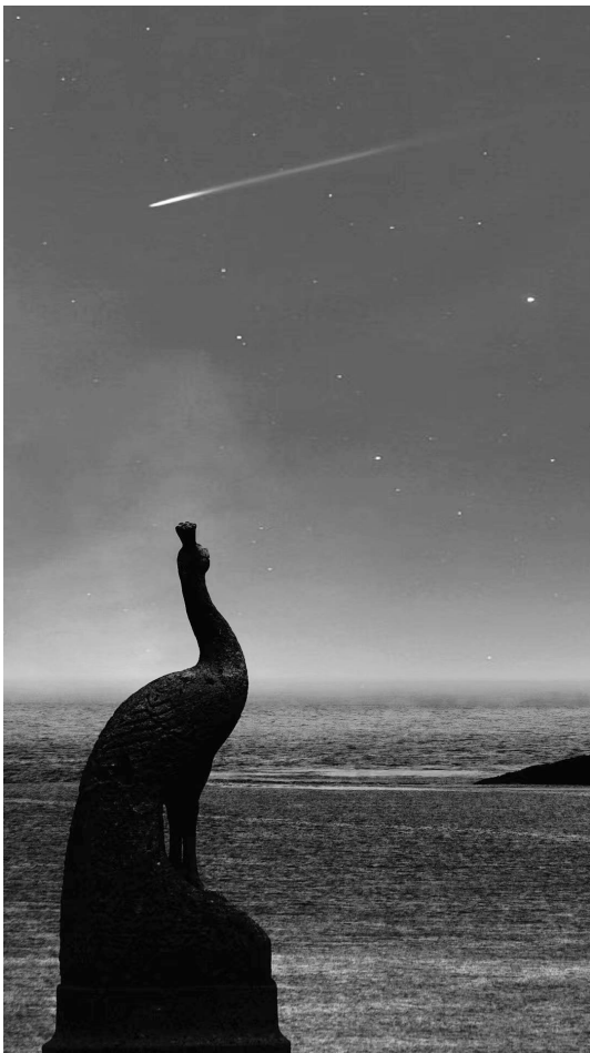
快拍快拍: 守望