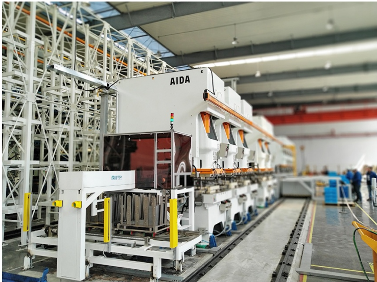
图为天成自控智能生产线

今后,我们将以本次对标学习为契机,开启全面对标新昌之路,认真取长补短,努力跨越赶超,在知不足中激发攻坚动力,在补短板中突破发展瓶颈,加快我县工业经济高质量发展步伐,为新时代“名县美城”建设提供更强动力。