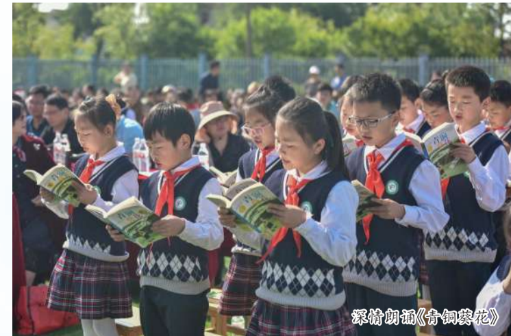
深情朗诵《青铜葵花》

书香沁校园,阅读润人生。亭西小学深化“书香校园”建设,以教师的读书带动学生的读书,以学生的读书推进家庭的读书,形成师生互动、家校联合、社区共享的读书生态氛围。