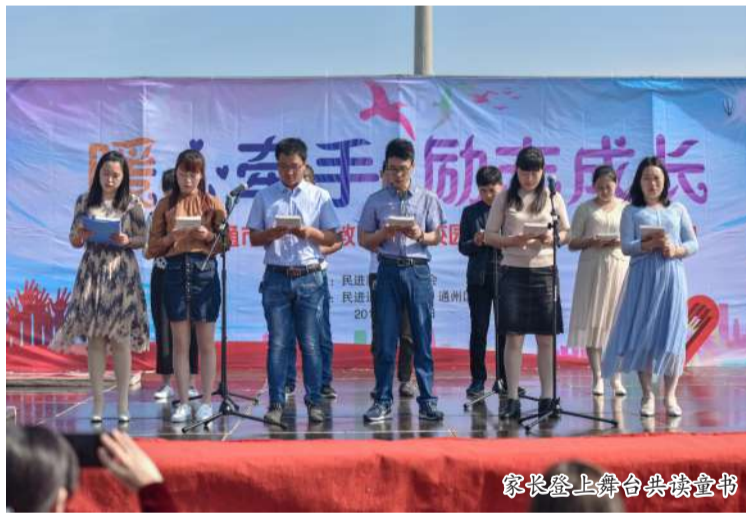
家长登上舞台共读童书

孩子们从变化的大自然中找寻乐趣,学习知识,春生、夏长、秋收、冬藏,连接每一颗童心。从方寸之间的植物角到庭院之间的校园万物,再到天地之间的大自然,孩子们沿着课堂通向生活的阶梯,阅读、实践、写作。花,还是园中的那朵花;树,还是校园里的那棵树。因为阅读实践的关联,儿童感受着自然科学的无限魅力,享受着理性阅读的深度幸福,他们便有了阅读学意义上的情感共鸣。