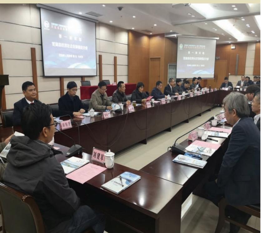
▲ 芜湖县招商引资专场对接会

略,聚焦开发区主战场,招商引资主抓手,狠抓服务企业共同发展理念,健全完善县级金融、政务、企业发展、人力资源四大服务中心,不断优化生态环境、营商环境、发展环境,努力为来县企业打造投资的福地和服的高地。今后,县委、县政府将持续打造芜湖县招商引资服务品牌,一如既往当好企业发展的政治辅导员、政策宣传员、发展勤务员、安全保卫员。县委副书记、县长韦秀芳向参会人员介绍了芜湖县经济社会发展及投资服务环境情况。