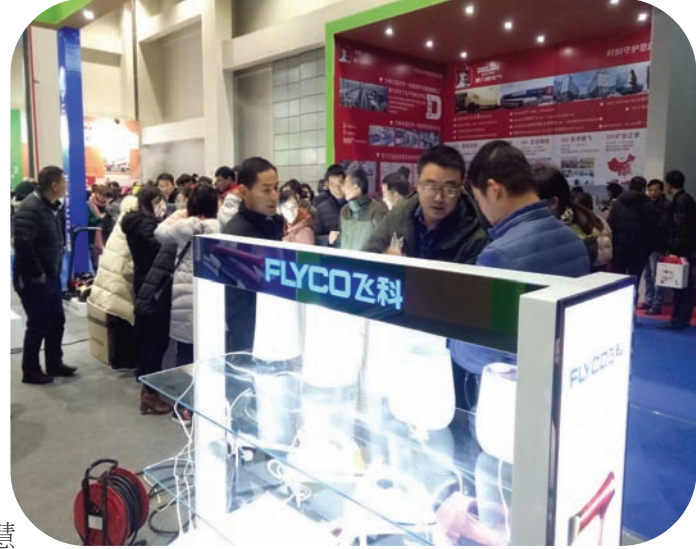
撰文:张梦婕

芜湖县招商引资专场对接会 市、县领导贺东、黄维群、韦秀芳、杨文玲、范碧清、阙方俊等出席签约仪式。县委书记黄维群主持会议。对接会上,副市长贺东发表了致辞,并站在全市的角度介绍芜湖县发展的有关情况,指出芜湖县具有创新的基因、开放的理念、精致的形态、和谐的氛围,欢迎广大企业家来芜湖投资兴业。县委书记黄维群在主持讲话中指出,一直以来,芜湖县秉持创新、开放、精致、和谐的城市精神,坚持工业主战