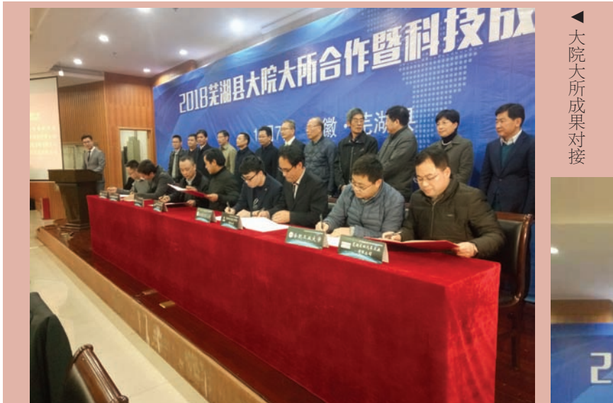
◀ 大院大所成果对接