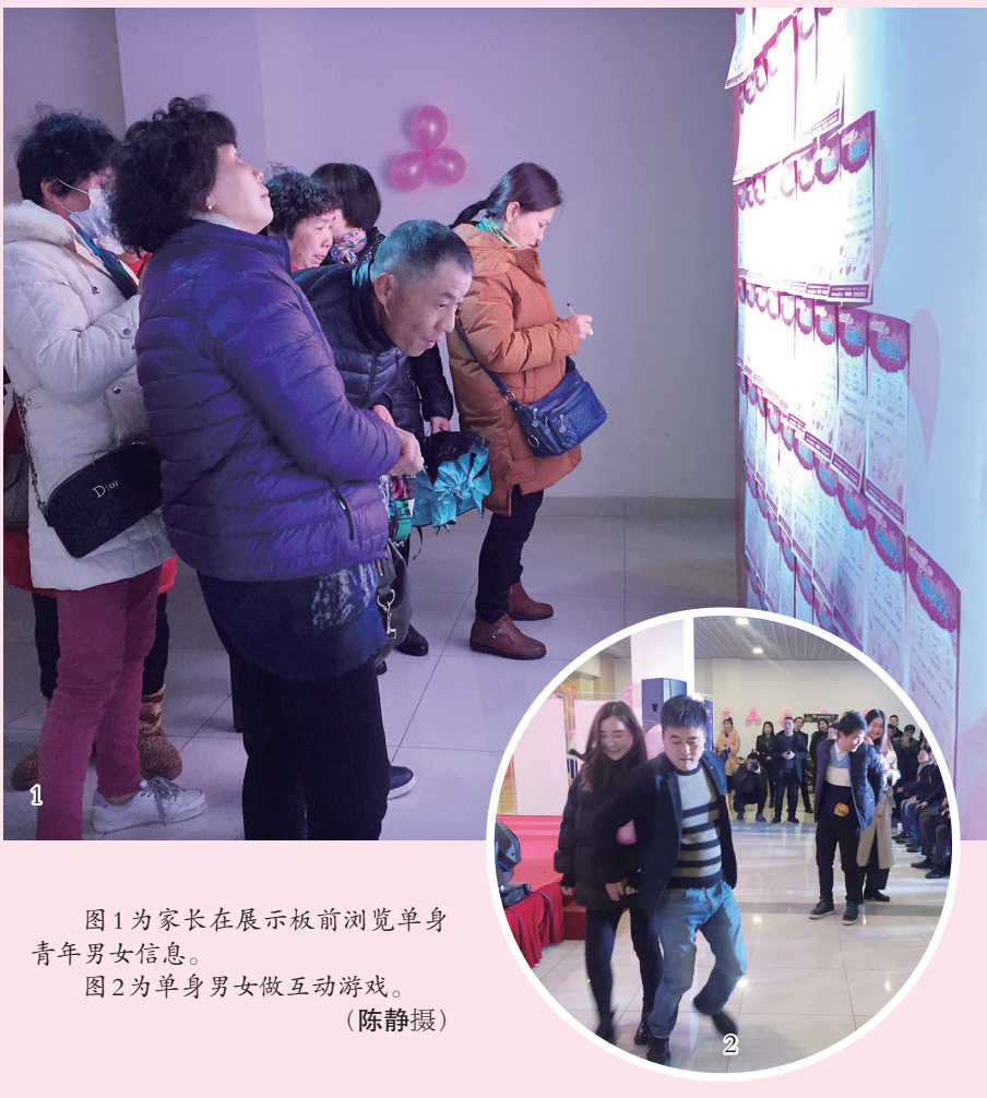
图1为家长在展示板前浏览单身青年男女信息。

主办方负责人说：“儿女的婚事，也是父母的心事。之前一直有家长联系我，希望我们可以提供一个平台，让双方家长也能坐下来交流。所以我们就举办了这次‘家长公益相亲会’，让单身青年男女和他们的家长都可以来现场互动交流。”