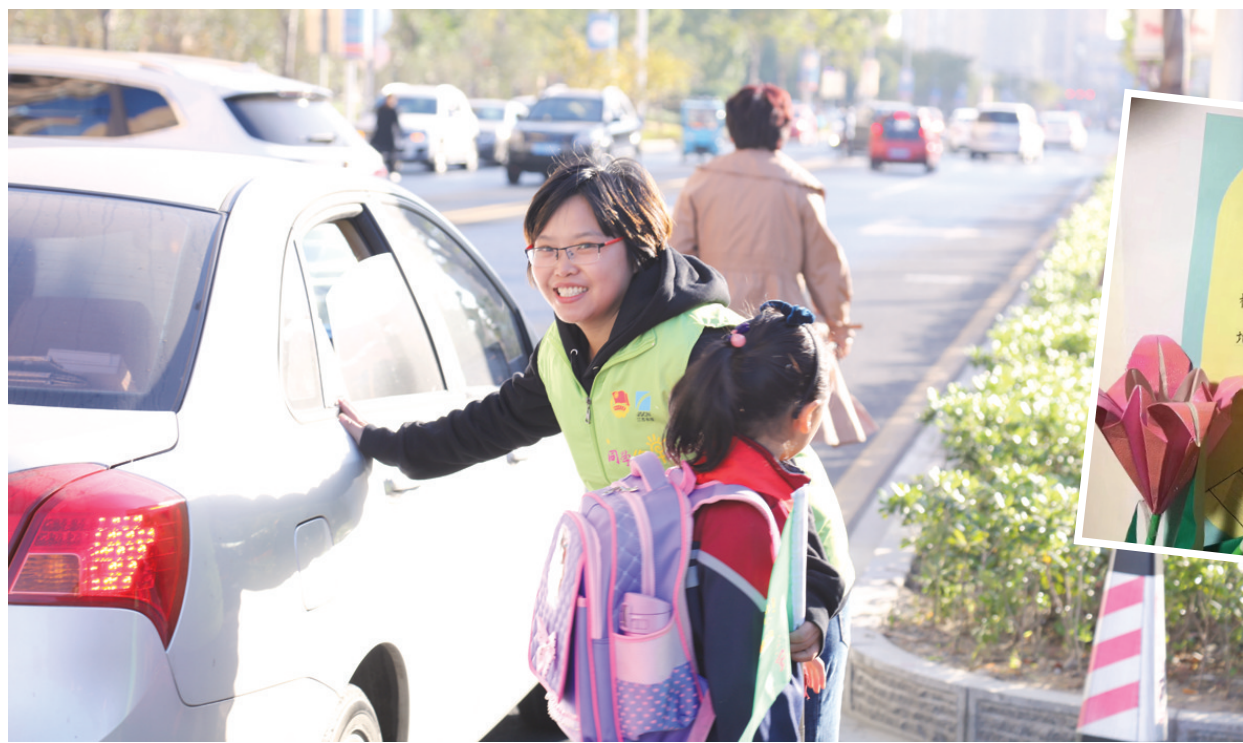
图为志愿者正在服务上学的学生。