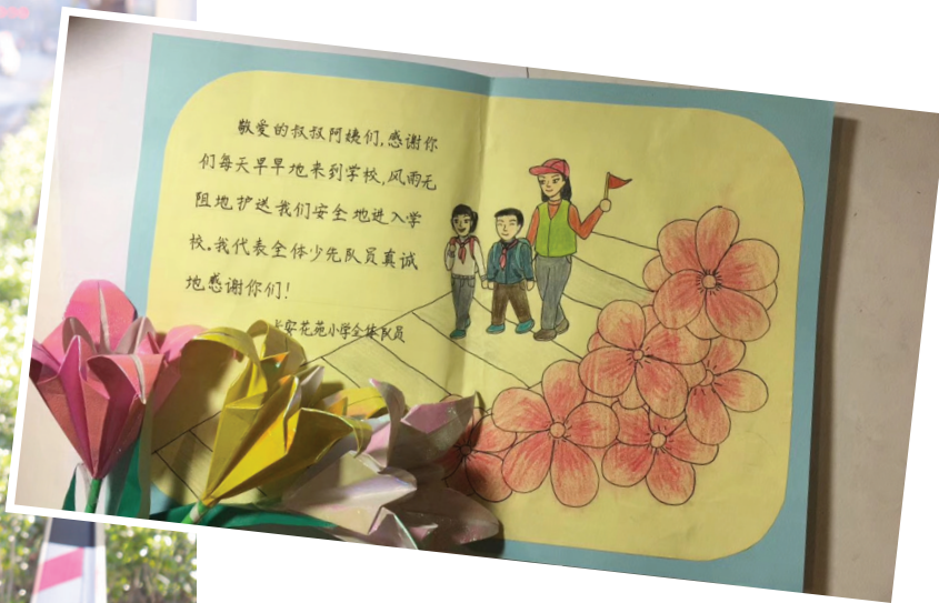
图为学生的感谢信。

2017年3月,吴江团区委联合区教育局、区公安局、江苏有线吴江分公司,共同组织发起了“同学,你早!”青春护航志愿者行动。两年来,青年志愿者纷纷走近学校,不仅以自己的无私奉献,疏导学校门口的交通、呵护学生的安全,更以身作则,让孩子们在耳濡目染中树立起“志愿服务最光荣”的意识,最终以小爱凝聚成大爱,以大爱引领吴江文明风尚。 两年来,“同学,你早!”青春护航志愿者行动逐步形成了“团区委协调保障,家长志愿服务,社会各方参与”的运行机制,区教育局推广、区公安局助力、区文明办保障后勤、江苏有线吴江分公司注资,为同一个目标不断努力。 目前,“同学,你早!”青春护航志愿者行动每年经费有近8万元,配备了马甲、雨披、帽子、旗帜、雨棚等物资,物资上都醒目地印着“同学,你早!”这句温暖的问候。 根据每所学校门口的实际情况,交警部门制订了精准