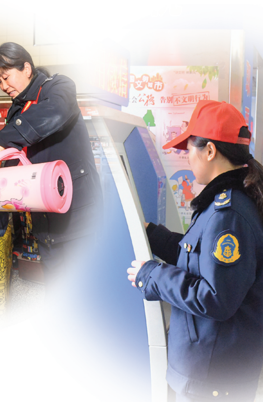
交通志愿者为旅客倒水。

据区运输管理处统计,今年全区投入春运工作的道路危险货物运输企业共有15家,参加春运的危险货物运输车辆267辆(挂车34辆),驾驶员、押运员505人,车辆、人员都持有有效驾驶证和从业资格证,具备道路危险货物运输从业资质。 为保障道路危险货物运输安全,春运期间,区运输管理处及时通过QQ、微信工作群将气象预警信息发送给企业,提醒企业注意防范,督促企业实时监控车辆运行状态,确保危险货物运输车辆在外的运输安全,春运期间要求危化运输车辆企业合理安排好运输任务,及时办理车辆停驶手续,节前共报停危化运输车辆109辆,并要求企业做好值班值守工作,上报值班计划。 同时,区运输管理处还积极督促企业加强对春运期间危险货物运输车辆的动态监控,严格控制驾驶员超速、疲劳驾驶、凌晨2-5点行驶等违规行为发生,特别是充分运用好已经安装好的车辆主动安防系统,加强对车辆、驾驶员的实时监控,分析报警信息,采取管控措施,消除安全隐患,防止事故发生。