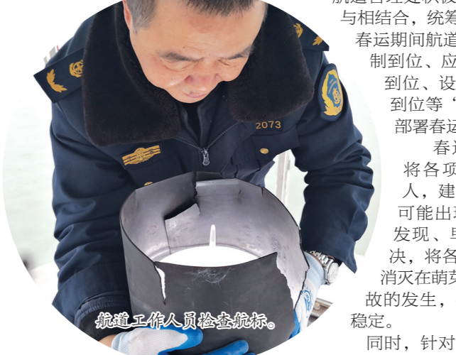
船坞工作人员综合检修。

航道管理处积极将船舶的安全保障工作与相结合,统筹谋划、精心安排,保障春运期间航道的安全畅通。从领导机制到位,应急机制到位,巡航检查到位,设备保养到位,值班制度到位等“五个到位”入手,全面部署春运工作。 春运期间,区航道管理处将各项安全防范措施落实到位,建立健全安全责任制,对可能出现的情况,做到早发现,早报告,早控制,早解决,将各种影响安全生产的隐患消灭在萌芽状态,杜绝安全生产事故的发生,确保春运安全生产形势稳定。 同时,针对吴江境内航道特点,区航道管理处紧紧围绕“安全、优质、及时、畅通、有序”的总体要求,完善各项应急措施,确保航道的安全畅通。航政人员和执法车、船全天候处于待命状