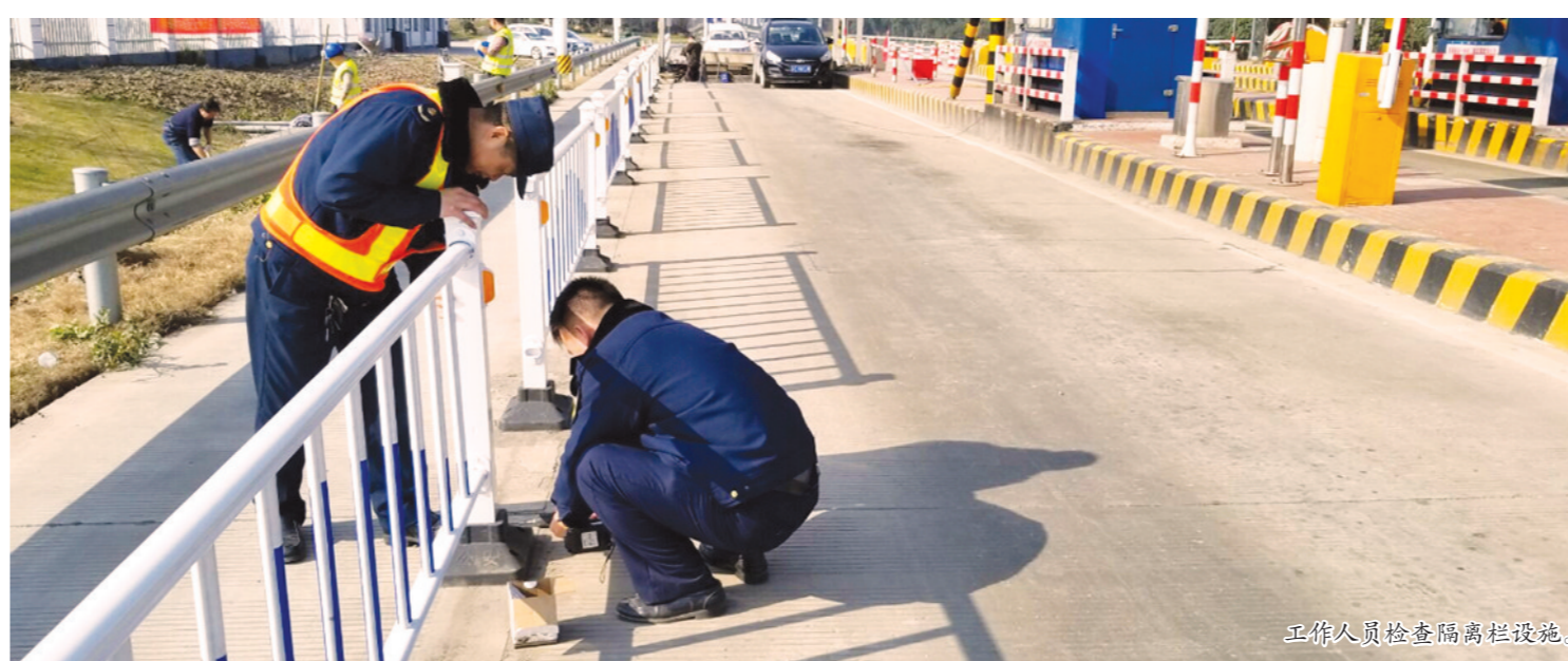
工作人员检查隔离柱设施。

在40天的春运中,区公路管理处在严格贯彻落实上级有关春运安全工作指示的同时,全面加强自查自纠,强化“红线”意识和“底线”思维,全力做好各项保畅通工作。 春运工作是交通行业一年一度的重要工作,区公路管理处结合自身工作实际,根据上级文件精神及工作方案,成立了春运工作领导小组,对春运工作进行动员部署。按照“谁主管谁负责,谁检查谁督办”的原则,成立了4个安全督查组,深入管理一线开展检查督查,并以多种形式开展春运安全宣传教育,责任到人,保障整个春运工作的有序开展。 春运期间,区公路管理处下属各收费站充分利用与群众接触较多的优势,在