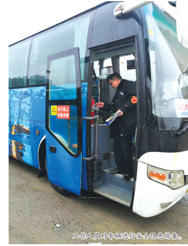
工作人员在车内做好隐患排查。