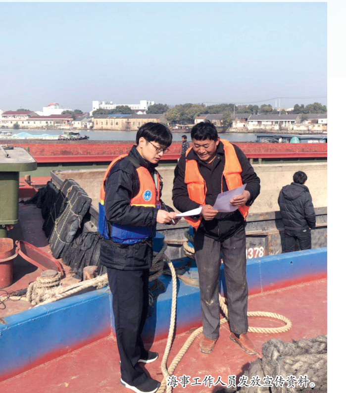
海事工作人员巡查辖区水域。

春运期间,水上交通安全形势稳定事关社会稳定和人民生命财产安全,区地方海事处坚持“安全第一、预防为主、综合治理”的方针,加强组织领导和安全宣传,开展节前检查和现场监督,切实保障春运期间水上交通安全畅通。 区地方海事处专门成立了以主要领导为组长、分管领导为副组长、各科室负责人及两所一点负责人为组员的春运和假日旅游运输领导小组,加强对2019年春运和假日旅游运输工作的指导,确保辖区水上春运组织工作顺利进行。平望海事所、震泽海事所、夹浦桥执勤点分别组建了应急队伍,负责抢险、救援等工作。 春运前,辖区两所一点迅速组织开展节前水上交通安全大检查,并结合当时各项安全检查工作加大隐患排查力度。对于发现的安全隐患,海事部门要求相关单位及其负责人务必按照“定时间、定措施、定人员”的原则,及时有效进行整改,督促立即或限期整改到位。区地方海事处节前还组建了3个督察小组到各所点辖区督查节前工作开展情况。 春运期间,海事各部门充分利用标语、群发短信、电子屏、可变情报板、宣传单等宣传教育形式,共发放《告知书》200余份,利用短信平台群发春运安全信息短信1600多条,切实做好水上交通安全宣传工作,进一步提高船户的水上交通安全意识,为保障水上交通安全营造了良好的氛围。 区地方海事处还根据春运期间辖区水上交通安全形势,把握关键、力求实效,有针对性地开展现场安全监管工作。 一是做好水上旅游风景区的安全保障工作。派出人员、艇力做好同里罗星洲、东太湖等水上旅游风景区水域举办的迎新春节活动的安保工作,着重做好罗星洲水上旅游景区除夕爆竹、初一烧香活动的水上安保工作。春节期间,吴江辖区罗星洲景区、东太湖景区、同里湿地公园、震泽古镇景区等各水上旅游风景区共安全运送游客63271人次,未发生安全责任事故。 二是加强危险船舶的安全监管力度。严格落实危险货物运输审核制度,加大实船检查率,督促船东双落空危险货物运输污染检查制度,春节期间共完成危险船舶进出港报备、危险货物运输申报13艘次。此外,书前还对辖区水上加油站进行了全面的安全检查,发现、排除安全隐患,确保水上加油站作业安全。 三是加大对重点水域的动态畅通和船舶航行安全。保障春运期间的航道畅通和船舶航行安全。 春运结束也标志着新的一年海事工作正式启动,区地方海事处仍将一如既往,以春运工作为契机,继续加强对违法船舶的打击力度和对重点船舶的监管力度,进一步加强对重点水域、重点航段监控能力,做到安全责任落实、监管前移、有备防范,切实加大各类事故隐患的整改力度,确保吴江水上交通安全、畅通、有序,保障人民生命财产安全。