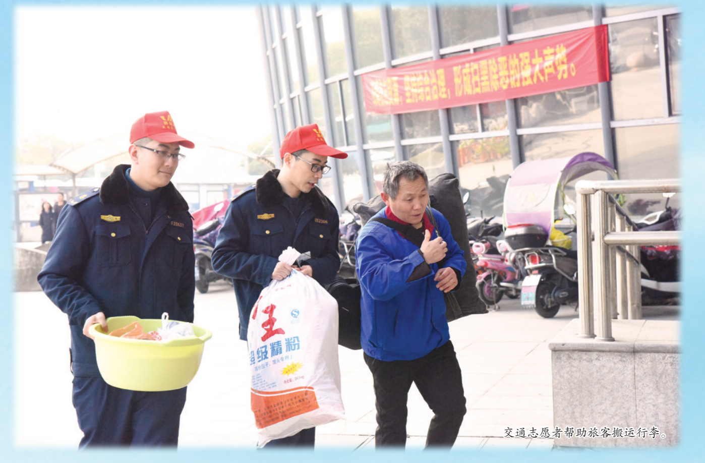
交通志愿者帮助旅客搬运行李。

应急处置工作,及时储备相应物资,调整人员部署,随时准备对公路桥梁、穿穿道通、施工路段等进行抢险除冰、清除路障、除雪铲冰等工作。为应对冰雪恶劣天气,提前与交警、综合执法大队、交警等部门确定大桥扫雪除冰保障责任分解表,落实扫雪除冰值班人员。春运期间,吴江虽然受降雪影响较小,但是降雨影响较大,为了确保降雨期间应急工作的顺利开展,区公路管理处相关工作人员及时制订方案,调整人员部署,落实应急举措。春运期间,成功处置国道省道和县道道路抢修、排除道路障碍等应急事项55次。 春运期间,全区公路整体运行情况良好,未出现重大险情,未发生因养护不到位而出现的有责事故。