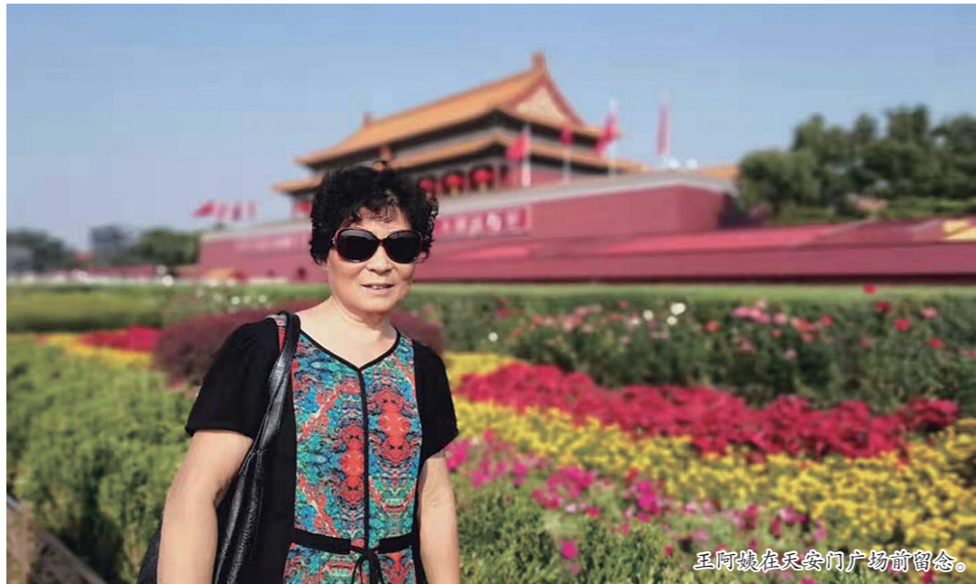
王阿姨在天安门广场前留影。