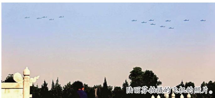
陆丽芬拍摄的飞机编队。

今年是新中国成立70周年，10月1日前后，首都北京到处都人山人海，除了在家收看激动人心的阅兵仪式和国庆晚会，也有部分吴江老人按捺不住内心的期待之情，在国庆期间前往北京，亲身体验祖国首都的节日氛围，感受国家的日益繁荣。