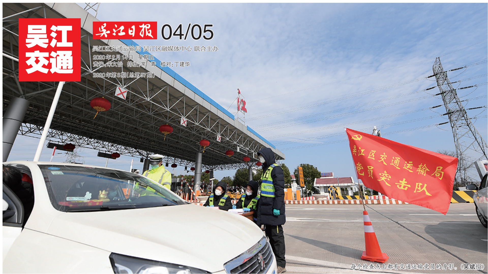
各个检查点都有交通运输党员的身影。