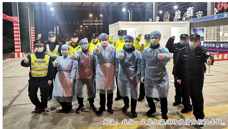
各地一线防疫检查点疫情检查站。