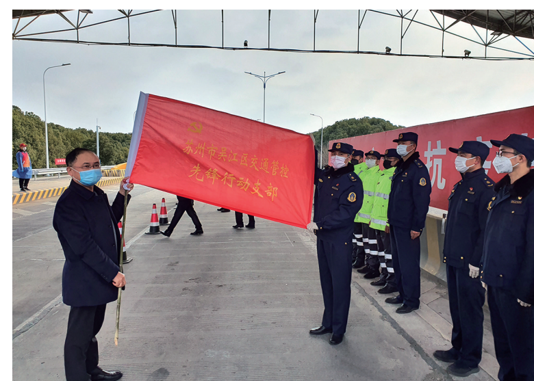
交通管控先锋行动支部授旗。

面对严峻的形势，交通党员始终坚守阵地，寸土不退，在设立的9个疫情防控交通管控检查点，24小时无休地对全部来吴车辆和人员实施停车检查，真正做到严防死守，不漏一人，不漏一车，筑起阻断疫情蔓延的坚固屏障。他们有的是主动请缨的女同志，有的是推迟婚期的小伙子……每一名平凡的党员，都是一面鲜亮的旗帜，他们以坚守诠释初心，用担当践行使命，让党旗在疫情防控一线高高飘扬。疫情的“战场”就是检验初心使命的“考场”，交通运输党员将勠力同心，众志成城，以实际行动彰显责任与担当，在这场疫情“大考”中向党和人民交出满意的答卷。(葛佳雷)