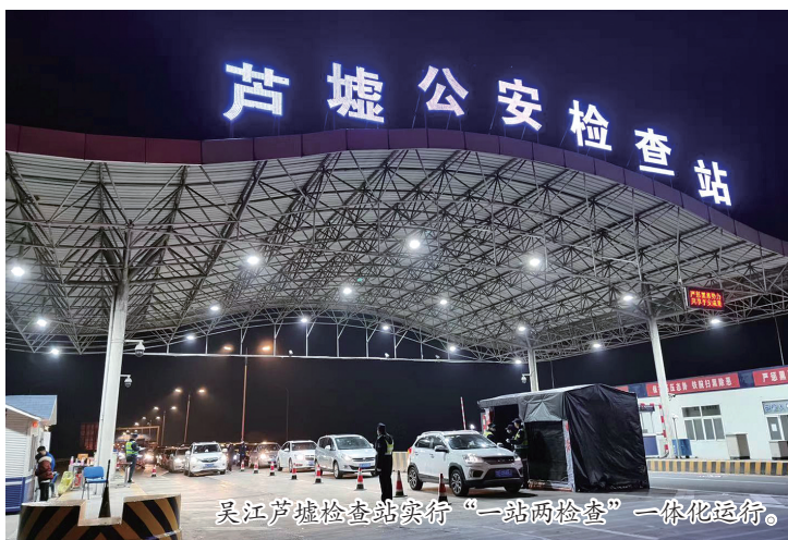
吴江芦墟公安检查站“一站两检”一体化防疫。

在吴江防疫一线，像他们这样在“疫”林中逆流而上的还有很多，他们是伴侣，是父女，也是战友，携手共赴抗疫第一线。在这场没有硝烟的战争面前，他们用热忱的初心，表达自己对党和人民的赤诚，用他们实实在在的肩膀扛起各自的职责，尽自己的力量为吴江人民的健康筑起坚实的防线！