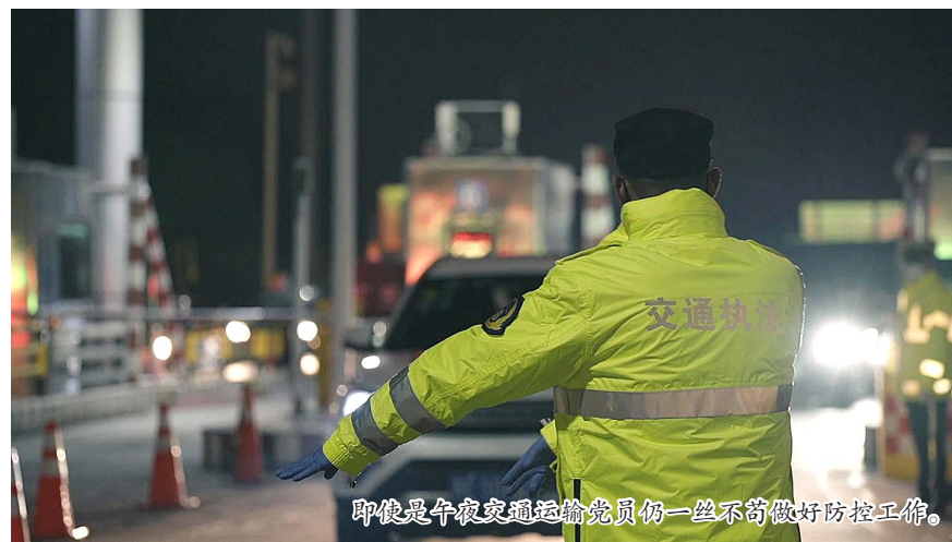
每个检查点都有交通运输党员的身影。