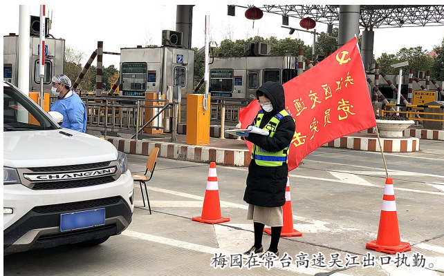
梅园在常台高速吴江出口执勤。