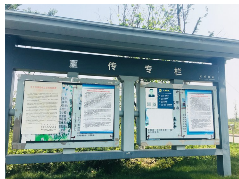
伍佑街道龙园新村南门宣传栏损坏,宣传画面老旧、张贴杂乱。