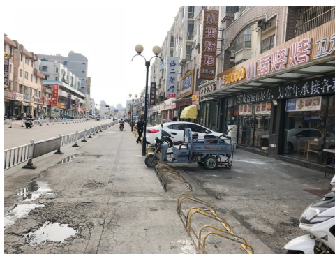
新河街道新河商业街小潘烧烤门前路面损坏,油污严重。