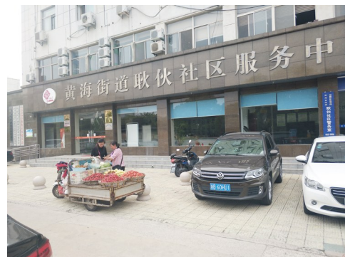
黄海街道耿伙社区服务中心前流动摊点无人管理。