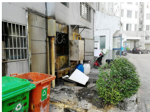
新都街道伟厦花苑二期垃圾桶破损、无盖,环境脏乱差,异味明显。