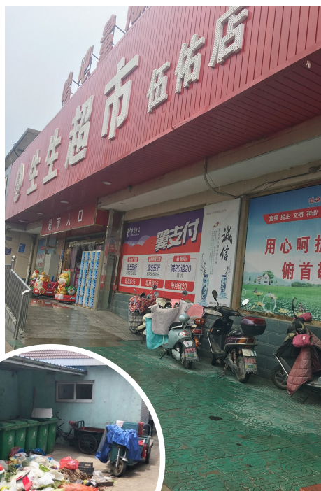
新河街道兴业路菜场室外西南角垃圾遍地。