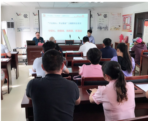
聚亨社区举办专题党课