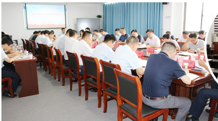
新河街道党工委中心组学习会议

新河街道以党工委中心组、新河讲堂等为载体，把握政治方向，采取集中学习和个人自学等形式，推进重点篇目“三必读”活动，专题学习习近平总书记系列重要讲话精神，中央、省、市、区关于推动高质量发展的部署要求、政策规定，党纪党规和作风建设制度文件，做到学以致用。