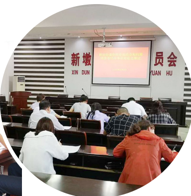
应知应会知识测试

次，增强党性修养。结合数字智能创新社区建设，进一步加强招商引资等方面专业知识的学习，举办招商引资专题讲座5次。每周二晚在串场河东“三清”工作指挥部组织机关、社区工作人员开展集中学习，并以考促学，开展党的应知应会和扫黑除恶专项斗争应知应会知识测试，检验学习成果。据统计，街道、社区集中学习40余次，学习强国的活跃度名列全区前列。为全力深化服务型新河，共建宜人宜居的新河提供有力的思想保证。