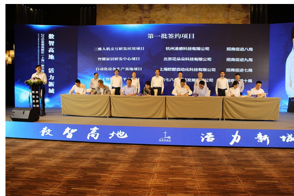
举行现代服务业投资说明会

各部门在开展重点工作、效能建设等方面存在的问题，对违纪违法问题，用好执纪监督“四种形态”，严惩不收敛、不收手和群众反映强烈的“微腐败”。结合街道开展“5·10”警示教育，观看警示教育片，集中学习《中国共产党廉洁自律准则》《中国共产党纪律处分条例》以及区党工委主题作风建设方案等法规文件，不断强化纪律规矩意识，以常态化学习，教育全体党员干部坚持道德“高线”。今年以来，共开展各类督查40次、作风建设督查20次，通报批评12人、书面检查4人、提醒谈话9人、诫勉谈话7人、党纪立案2人。