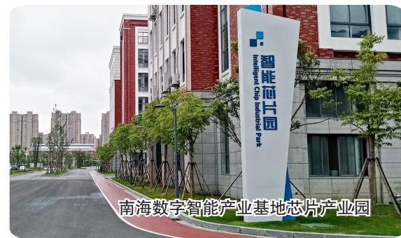
南海数字智能产业基地芯片产业园

“当前,盐南高新区正抢抓‘新基建’国家战略机遇,坚定不移高举大数据产业大旗,坚持‘产业数字化、数字产业化’导向,以完善的基础设施、丰富的资源要素、便捷的综合交通和优惠的政策扶持为基础支撑,积极融入数字经济和科技创新浪潮,加快建设西伏河‘科创走廊’和大数据产业园。”6月23日上午,在西伏河数字智能创新社区举行的全市5G网络建设和推广应用招商推介会上,我区全面吹响布局新基建、抢占新风口的冲锋号角。而观摩现场,渐成规模的新基建项目更为所有人展示出拳拳组合,拳拳发力的豪迈之势。