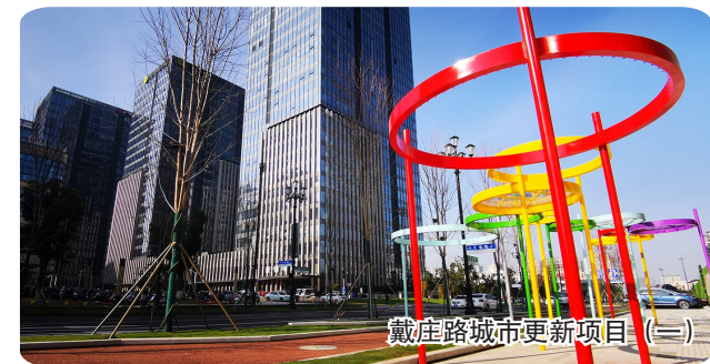
戴庄路城市更新项目(二)

一个个“重磅”产业项目冲击着观摩人员的眼睛,而红色“盐”未来的戴庄路城市更新项目则温暖着观摩人员的心田。这个被市民誉为“盐城最美道路”的网红打卡点,给观摩成员留下深刻印象。