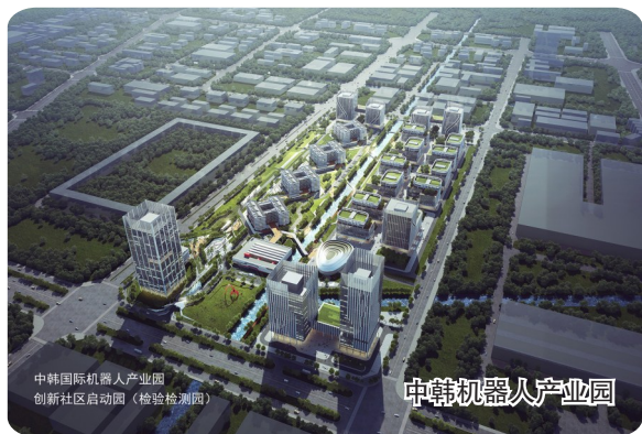
中韩机器人产业园