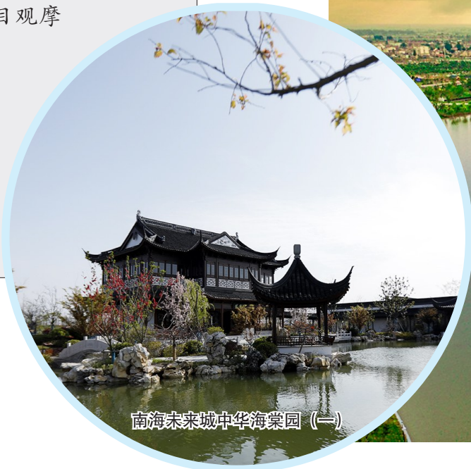
南海未来城中华海棠园(一)

编者按:盛夏的盐南,万物繁盛。在这生机盎然的季节里,第四次全市高质量发展项目观摩推进会顺利召开,以“海盐白”“革命红”“生态绿”“幸福橙”“科创蓝”五大色调为主线的盐南观摩项目,向观摩团成员生动展示出盐南人同绘五彩盐南,共筑都市新城的蓬勃热情。