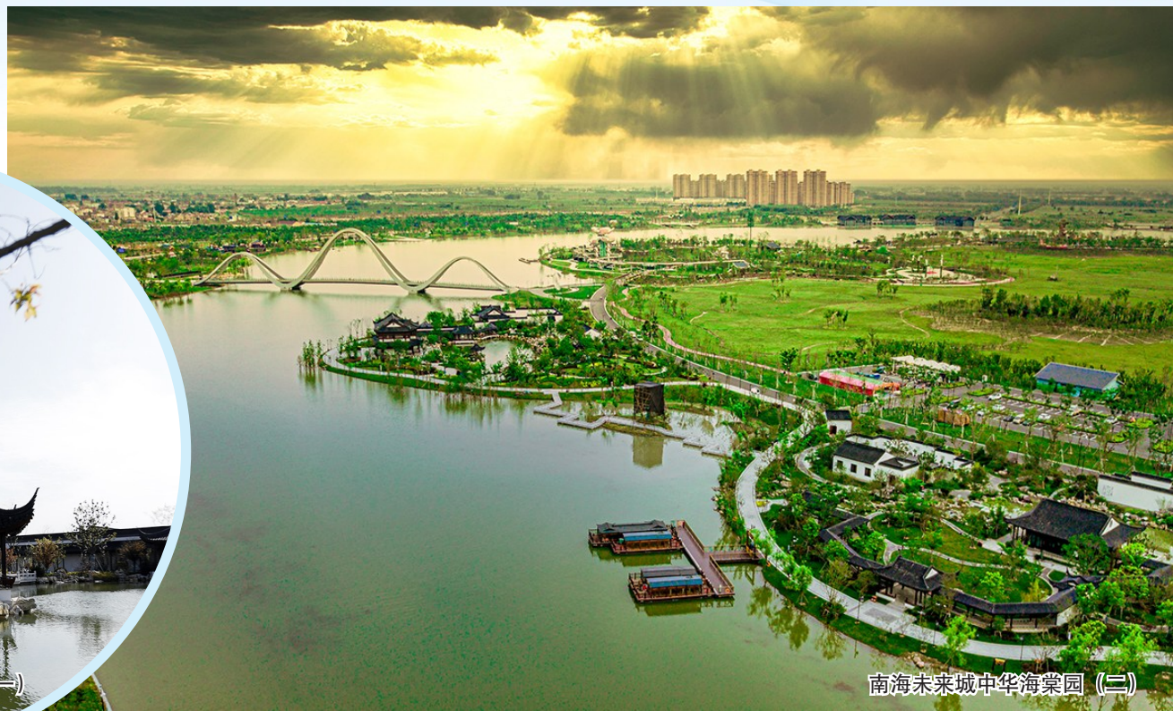
南海未来城中华海棠园(二)