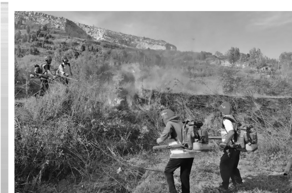
周营镇开展森林防火演练

通讯员 潘成磊报道 沙沟讯 今年以来，沙沟镇以推进美丽乡村建设为抓手，持续推进农村房屋管理，加强房屋隐患排查，让群众住有所居、住有优居。 强化组织领导，落实工作责任。沙沟镇成立农村房屋安全隐患排查整治工作领导小组，制定工作方案，召开全镇农村房屋安全隐患排查整治培训会议，进一步细化工作责任，倒排工期，为农村房屋安全隐患排查整治工作顺利开展提供有力的组织保障。 强化宣传引导，营造良好氛