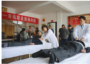
5月18日上午,市康复中心的医生们自发来到市福利院给这里的老人免费拔火罐、按摩、量血压,老人们对此赞不绝口。

近日的天气让期待入夏的小伙伴有点泄气,没有阳光的眷顾,气温失去上升的动力,需要穿上外套才能抵挡户外的冷风。今天,阳光有望赏脸,我市气温进一步回升,在17℃至26℃之间,但雨水的脚步依旧紧逼,大家要抓紧时间洗晒晒晒,多准备些衣物备战接下来的阴雨天。一到夏天,一些上班族的臀部、腿上就开始长出脓包,苦不堪言,其实这和上班族久坐不运动有关。当臀部、大腿出汗多又不透气,很容易引发各类皮肤病或感染。所以上班族在夏天应该多起身走动,拍一拍屁股,对臀部肌肉是一种非常有效的放松。(张变鸾)