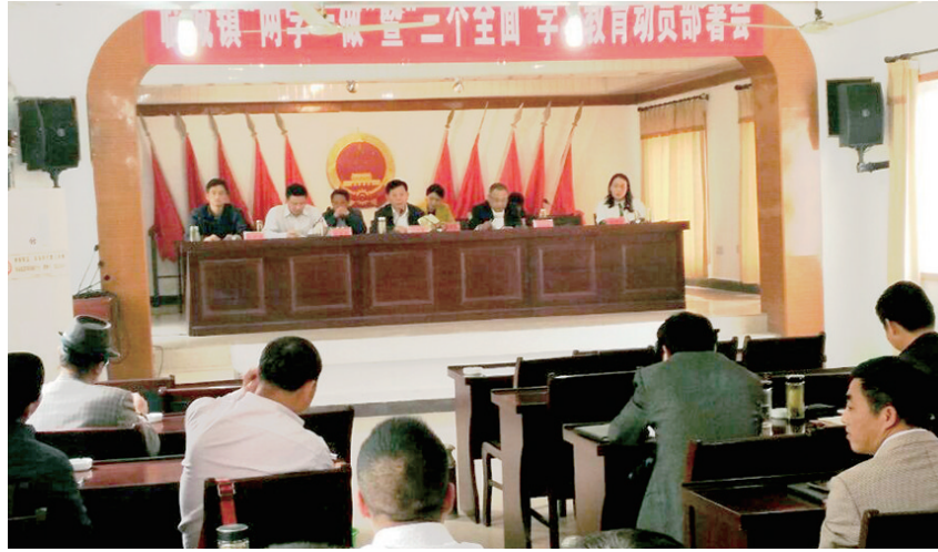
总结回顾。他指出,通过这次培训,大家的理论基础得到夯实,政策水平得到提高,工作能力得到增强,党性得到锻炼,责任感和