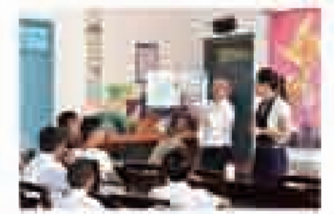
车友会成员与校方交流