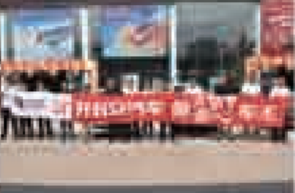
活动现场展示的车辆