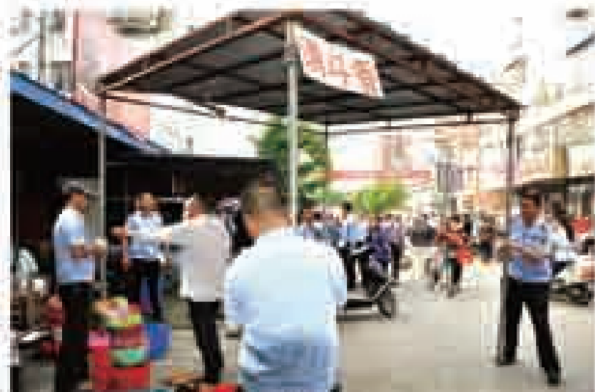
文林路整治占道经营活动现场