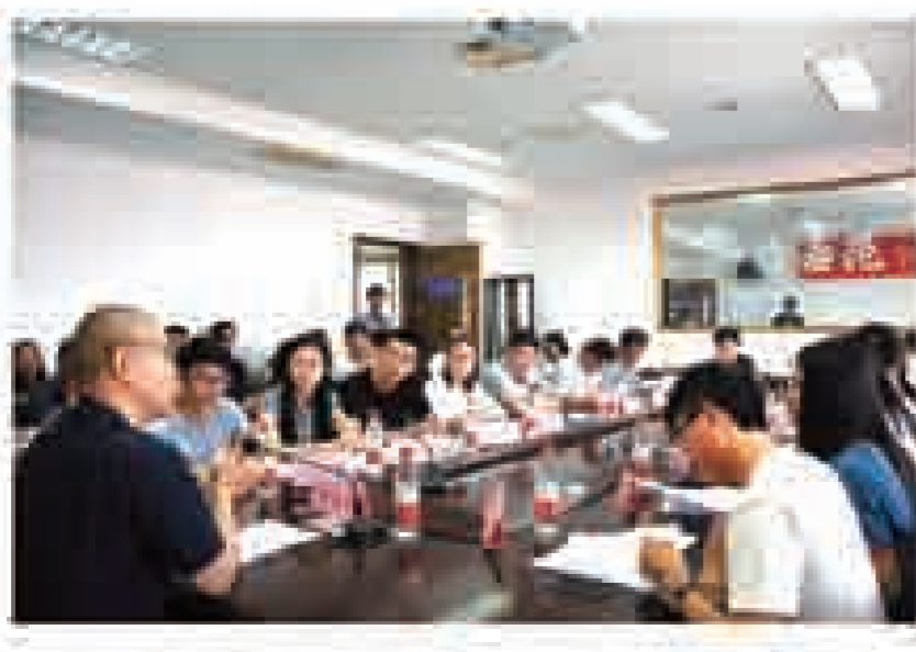
毕飞宇工作室第六期小说沙龙活动现场