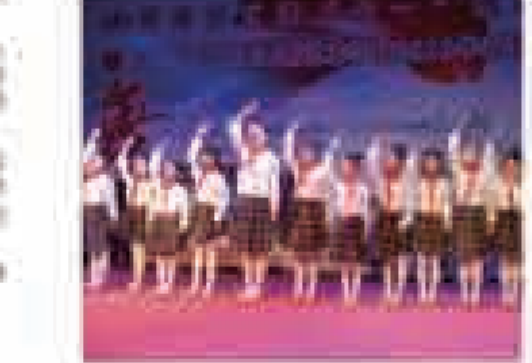
盐城师范学院的文艺表演