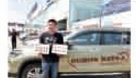
车友会成员与孩子互动