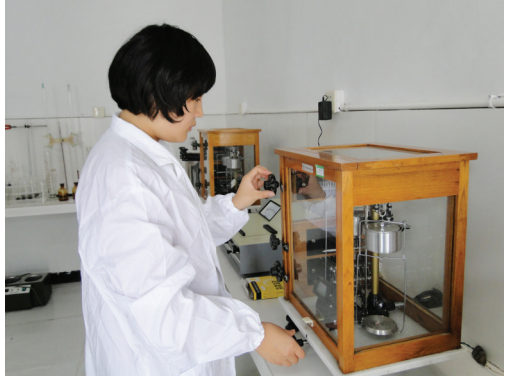
对过滤的米甜酒进行出厂前检测。