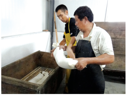
将原料缸内的原料进行压榨制酒。