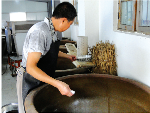
往装好糯米饭的原料缸里加曲制酒。