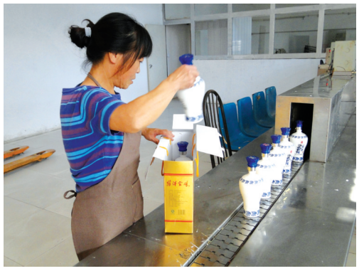
对成品米甜酒进行外包装。