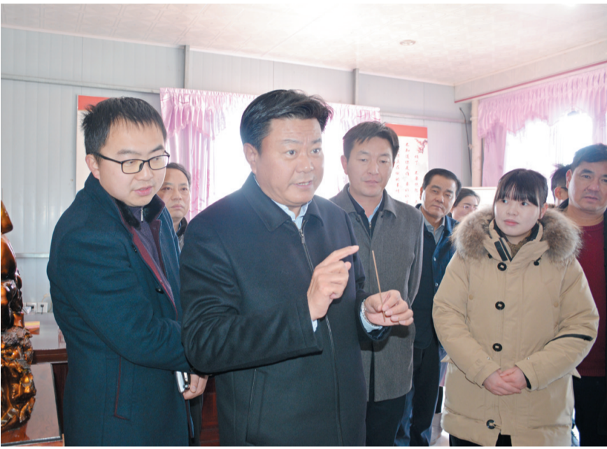
里有几亩田?”在戴家村, 李卫国亲切询问起正在制作渔网网的老人收入情况及身体状况。在得知戴家村渔网编织年销售额已达亿元以上, 年支付劳务报酬2500多万元时, 李卫国说, 这是一个好产业, 是一个富民的

本报讯(记者 徐冬梅)3月2日, 市委书记李卫国带领市委办、政府办、人社局、农业局、水产局、林牧业局、农工办等相关部门负责人, 调研我市“一村一品”工作开展情况。市委副书记葛志晖、副市长刘汉梅参加调研。 上午, 市委书记李卫国一行首先来到竹泓镇冯家村天亦香果品农庄、泓香玉葡萄基地, 与农庄主亲切交谈, 详细了解葡萄种植、销售等情况。“目前葡萄有多少品种? 最受市民欢迎的是哪个品种? 流转了多少亩土地? 亩产达到多少? 果农的收入情况怎么样?”李卫国详细询问葡萄种植情况。在听取农庄、基地今后的发展定位后, 李卫国表示, 要进一步提升产品档次, 加快推动葡萄种植规模化、标准化, 借助开展自驾游采摘活动, 大力发展“农业+旅游、农业+休闲”模式, 做大做强农庄, 争创特色基地。在竹四村, 李卫国还深入佛香制作车间, 详细了解企业产品生产、销售及用工情况。 在林湖乡姚富村调研时, 李卫国了解到, 该村的调味品厂已达13家, 现从事调味品经营、生产、销售人员800多人, 并带动了相关产业链的发展。李卫国对此表示欣慰, 他希望调味品厂要进一步扩大规模, 敢于突破、寻求创新, 使企业的产能和经济效益得到进一步提升。“老人家, 您今年多大? 一天工资多少? 一个月工作多少天? 家