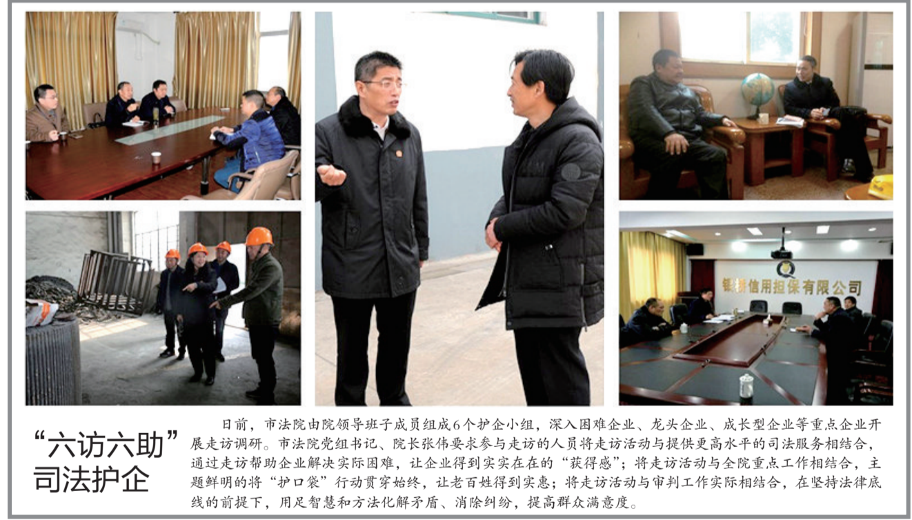
“六访六助”司法护企

法服务, 共同防范金融风险。他也希望各家银行能积极配合法院工作, 特别要增强诉讼案件的跟踪对接以及执行中查询、冻结、扣划的协助配合。针对现阶段金融纠纷激增、不良贷款难收等难题, 双方应在充分研判形势的基础上共破难题, 共建和谐、平安的金融环境。(顾新燕)