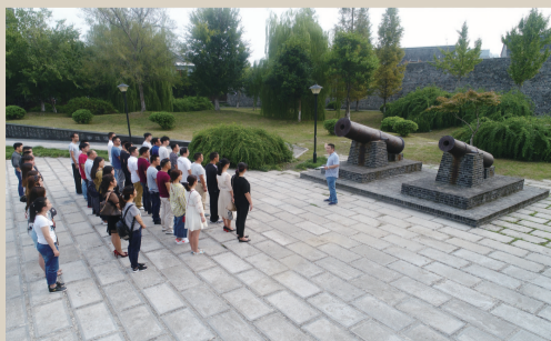
明城墙遗址公园成了爱国主义教育基地。