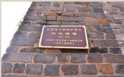
2002年，兴化古城墙被列为江苏省文保单位。

2006年10月，市政府专门召开城区古城墙维修保护会议，进一步明确了相关部门的职责分工与具体任务。以“保护为主，抢救第一，合理利用，加强管理”为指导思想，按照“修旧如旧，保持风格，整体规划，分步实施”的方法步骤，先修缮东岳庙后侧地块现存的一段城墙。修缮后的这段城墙长约70米，形体硕大、厚实坚固、雄伟壮观，较好地展现了明朝江淮水城特色。城墙北侧新建了约10亩的古城墙遗址公园，让市民、游客们站在公园里向南就可眺望城墙。前几年，市政府依据明朝兴化城墙的建筑风格在银北门街区南侧新建了一座北门城楼，巍然耸立、雄厚方正，有一种坚固持重之感，每个水乡人都为之骄傲、赞叹。今年，市政府决定整治小东门古城墙及周边环境，相关工作正在科学、有序地向前推进，将逐步恢复现存古城墙古貌。