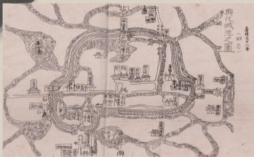
清朝嘉靖三十八年兴化城墙示意图。

“登城而观，内可鸟瞰全城，街道纵横，行人络绎，坊表林立，市景繁华，脚下城墙向两边蜿蜒伸展，如环龙盘卧。外亦可远眺景色，大河环绕，碧波荡漾，白帆点点，绿树成荫，田野牧歌，似天堂仙境。”这是史书上的记载，描写了兴化古城墙在一段时间内的周边景象，讴歌了水乡先民们的聪明智慧和高超建筑技艺。