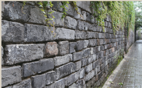
现存的小东门古城墙。