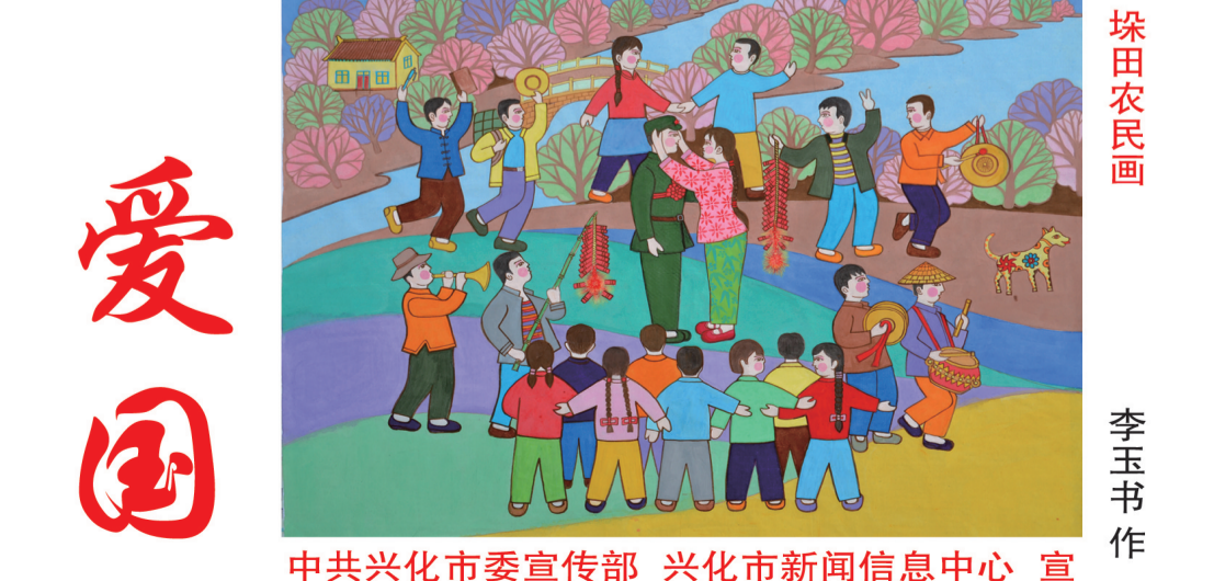
李玉石作 中共兴化市委宣传部 兴化市新闻信息中心 宣