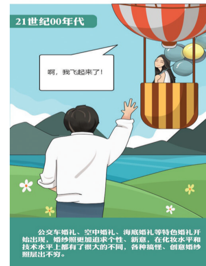
21世纪00年代 公交车婚礼、空中婚礼、海底婚礼等特色婚礼开始出现,婚纱照更加追求个性、新颖,在化妆水平和技术水平上都有了很大的不同,各种怪诞、创意婚纱照层出不穷。

□公 页 近日,支部召开了一次生活会,开展批评和自我批评,有两位党员相互批评时,正面对质,言辞激烈,步步紧逼。 打开天窗说亮话,就好比在打开了天窗,见到了阳光,在光天化日之下,所讲所言,不遮不掩。掏出来的是心窝里的话,肺腑之言,坦诚相见。锣不敲不响,鼓不擂不鸣,尽管也有周折,但最终解决了问题。 说亮话就不会是假话。亮话是实话、真话,坚持对人对己的批评始终贯穿实事求是的原则,一切从实际出发,批评别人不缩小,不夸大;不截短,不抬高。批评者说的是真话,接受者才会“闻过则喜,知过不讳,改过不悛”。 说亮话不会是大话和空话。亮话以实打实为本,而大话和空话则以假大空见长。如今有了网络和手机,不出家门也不可尽知天下事,打电话,发发微信,所获之知,不管怎么样比不上实实在在的感知,隔空传来的话难免不空。至于大话则是空话的学生兄弟。因此,没有眼见为实的底气,何来针锋相对的勇气。 说亮话不会是因话和没话。这是两股道上跑的车。说闲话无所事事,捕风捉影,杯弓蛇影;说三道四,搬弄是非;煽风点火,挑拨离间;会上不说,背后乱道。 开展批评和自我批评是我们党的三大