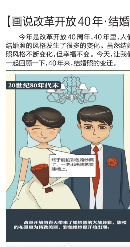
20世纪80年代末 改革开放的春天带来了婚纱照的大放异彩,影楼的布景更为精致美丽,彩色婚纱照开始出现。

□人民日报评论员 “新一代民营企业家要继承和发扬老一辈人艰苦奋斗、敢闯敢干、聚精实业、做精主业的精神,努力把企业做强做优。”在民营企业座谈会上,习近平总书记着眼民营经济健康发展,对广大民营企业健康成长提出希望、寄予厚望,鼓舞了广大民营企业积极进取、奋发有为的信心,激发了他们战胜困难、搞好经营发展的干劲。 市场活力来自于人,特别是来自于企业家,来自于企业家精神。改革开放40年来,我国民营经济之所以能从小到大、从弱到强,是与广大民营企业辛勤劳动、不懈奋斗分不开的。1980年,温州的章华妹领到了第一张个体工商户营业执照;到1987年,全国城镇个体工商户等各行业从业人员已达569万人;截至2017年底,我国民营企业数量超过2700万家,个体工商户超过6500万户。长期以来,广大民营企业家以敢为人先的创新意识、锲而不舍的奋斗精神,组织带领千百万劳动者奋发努力、艰苦创业、不断创新,不仅直接促进了民营经济的发展壮大,更使民营经济成为推动我国发展不可或缺的力量。 新一代民营企业家要更加奋发有为,就需要各级党委和政府为他们健康成长创造良好环境条件。习近平总书记曾强调,要坚持团结、服务、引导、教育的方针,一手抓鼓励支持,一手抓教育引导,关注他们的思想,关注他们的困难,有针对性地进行帮助引