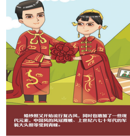
21世纪10年代 婚纱照又开始流行复古风,同时也增加了一些现代元素,中国风的凤冠霞帔、上世纪六七十年代的军装大头照等受到青睐。