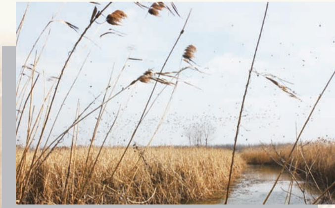
徐马荒的鸟