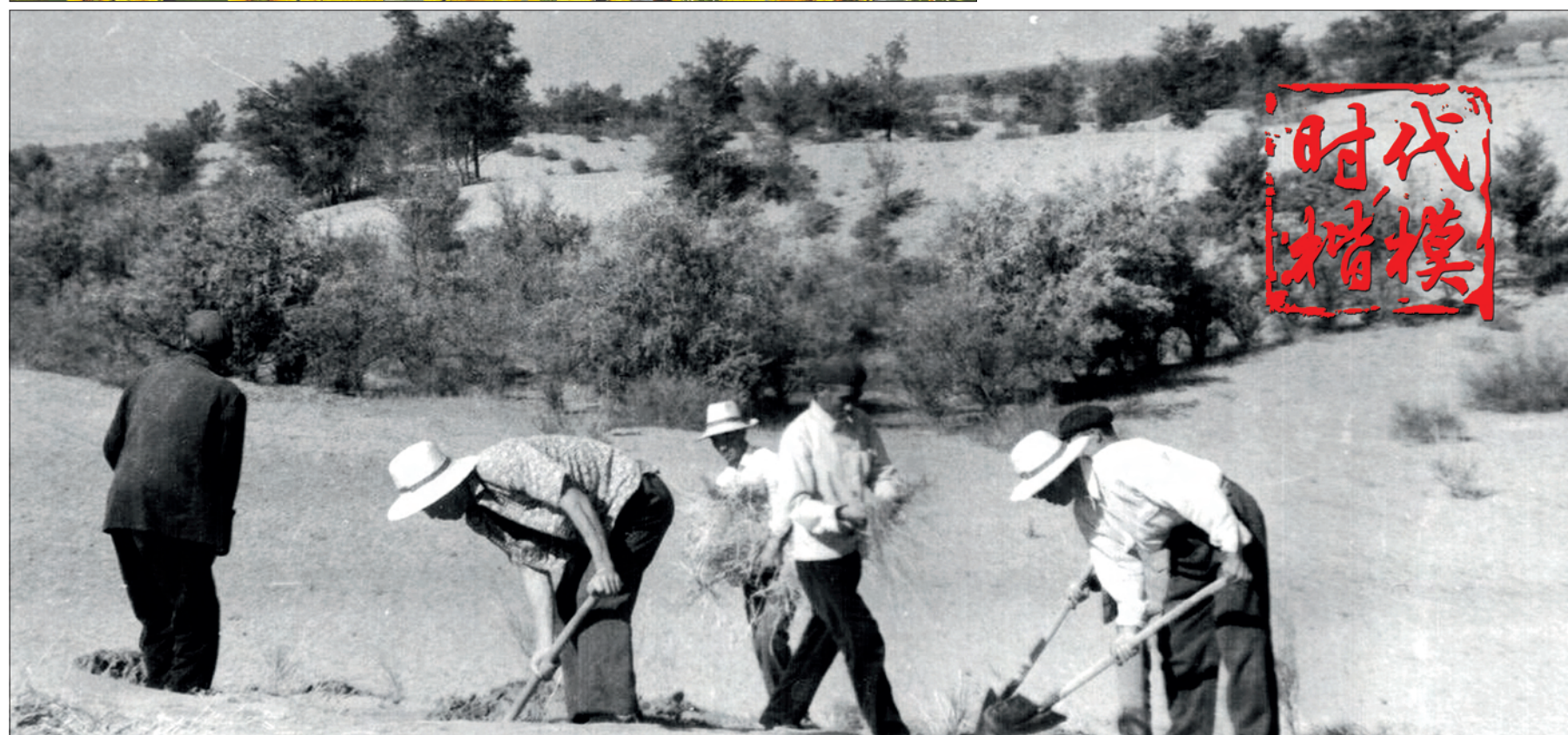
甘肃省古浪县八步沙林场 “六老汉”三代人治沙造林先进群体