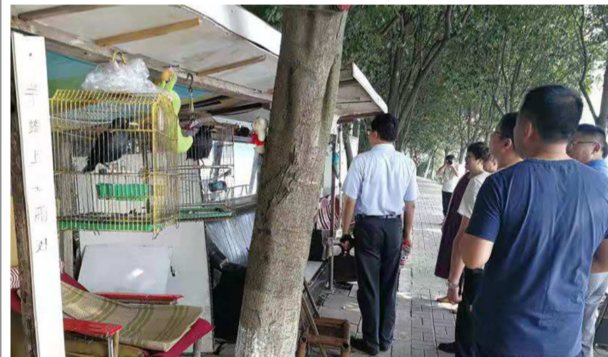
辖区内防洪墙发现有居民自搭遮阳棚,社区发动在职党员清理杂物并捐款购买爱心椅子,供居民休息。