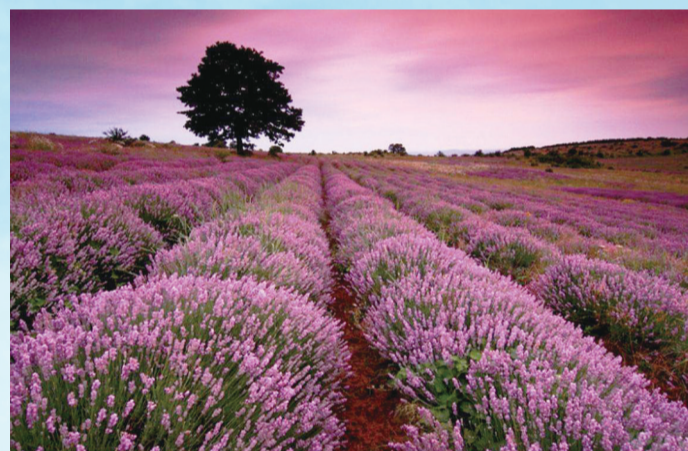
法国普罗旺斯薰衣草花海