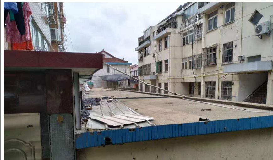
教师楼住处的车库平顶,一些杂物长期暴露在外,没有人处理,社区联合相关部门进行专项整治,环境明显改善。