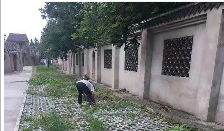
拥军桥东巷有大量野草,经整治后干净整洁。