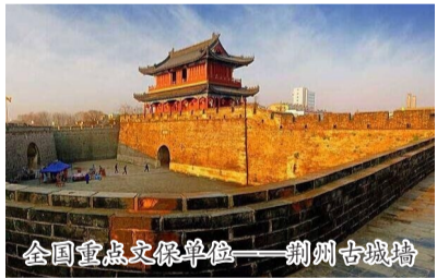
全国重点文物保护单位——荆州古城墙

近日,市申报国家历史文化名城领导小组办公室调研组,赴湖北省荆州市、钟祥市考察学习历史文化名城保护工作。