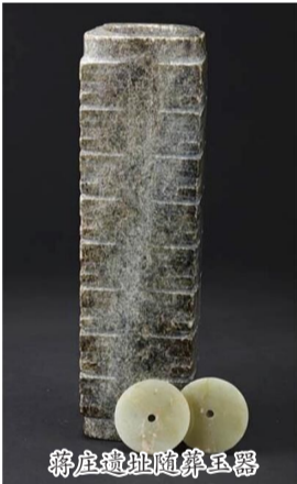
蒋庄遗址随葬玉器