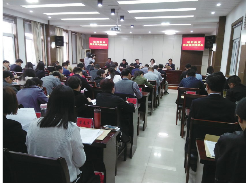
昭阳街道创业富民推进会现场。

日前，记者从市人社部门了解到，截止11月底，我市完成创业培训5083人，其中电子商务培训2300人；新增创业16049人，其中扶持新增自主成功创业4628人，5名当年新增创业获省、泰州市表彰，得分排名泰州第一。