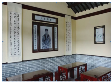
韩家窑村韩氏宗祠一隅