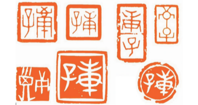
■/庚子年印 邢朝珑 刻

工作到不知今天是星期几,也没认出不远处那个戴着口罩的人是誰。大家都戴着口罩,遮住了坚毅或美丽的脸庞,但遮不住的是大家坚定的信念和坚持的恒心。没有一场疫情不可过去,没有一个春天不会到来。相信摘下口罩,彼此温暖微笑的日子就在不远处,让我们共同期待!