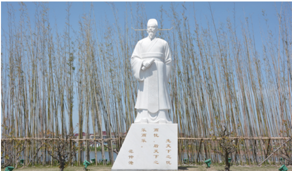
乌巾荡范仲淹立像

北宋天圣初,著名政治家范仲淹在兴化担任知县期间,筑长堰,招流散,励农事,兴学宫,敦礼教,厚风俗,建园林,兴城市,严吏治,清政事,新闢初试,造福一方。他以自己的端方廉肃为后来居官兴化者树立了榜样,更给兴化留下独特于江淮的“景范”文化。在这种“景范”文化的影响下,历代兴化人民特别重视生产和建设,景仰教育和文化,推崇史治清明。 “以范之功业,常昭于天下后世。”兴化人除了牢记“范公堤”之外,对范仲淹的崇敬之意,随着时间的推移越来越深厚。