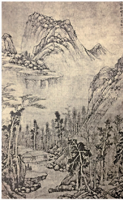
黄公望《水阁清幽图》

元代著名画家黄公望(1269-1354年),本名陆坚,后过继平阳县黄氏为子,才改为“黄公望”,即黄公久所“盼望”的意思,字子久,晚年称“平阳黄公望”。黄公望以画闻名于世,更以其代表作《富春山居图》享誉海内外。其实,黄公望除作画外,其他亦出类拔萃。元钟嗣成《录鬼簿》称:“公望之学问,不待文饰,至于天下之事,无所不知,下至薄技小艺,无所不能。”