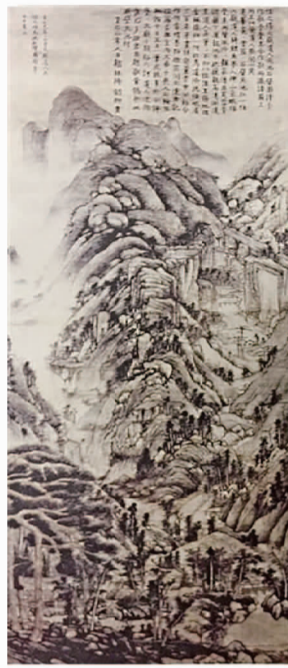
黄公望《天池石壁图》