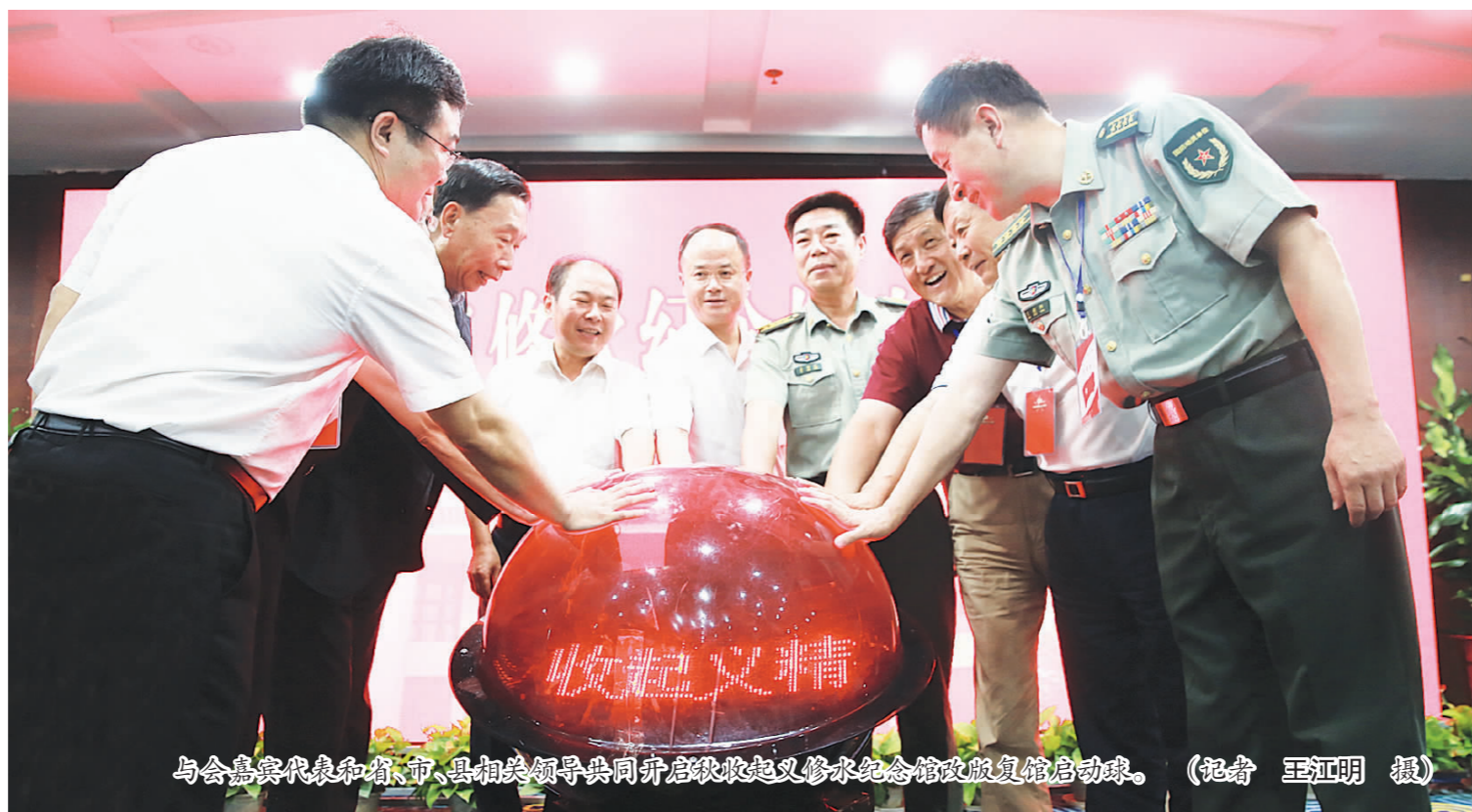
与会嘉宾代表和省、市、县相关领导共同开启秋收起义修水纪念馆改版复馆启动球。