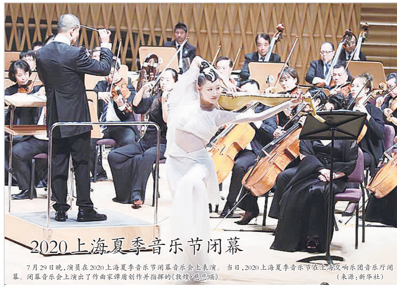
2020上海夏季音乐节闭幕

“十四五”期间,我国将组织开展松材线虫病防控5年攻坚行动,遏制松材线虫病快速扩散蔓延势头。到2025年,力争实现全国松材线虫病发生面积和疫点数量双下降,松材线虫病防控形势得到根本好转。 这是记者7月29日从国家林业和草原局了解到的。据国家林草局有关负责人介绍,松材线虫病是目前全球森林生态系统中最具危险性、毁灭性的病害。入侵我国38年,已扩散至18个省(区、市)、672个县(市、区),累计致死松树超过6亿株。 这位负责人说,攻坚行动将按照控制增量、消减存量,新发疫区实现“早发现、早报告、早除治、早拔除”,老疫区实现“拔除一批、压缩一批、控制一批”的总体要求,聚焦疫情监测调查、疫点疫区除治、疫情传播阻截、健康松林保护等关键环节,强化各项支撑保障,以县域为单位持续推进、精准发力,通过开展分区分级管理、因地制宜科学防控、压实目标责任,强化督查监管等措施,坚决打赢松材线虫病防控攻坚战。 (来源:新华网)