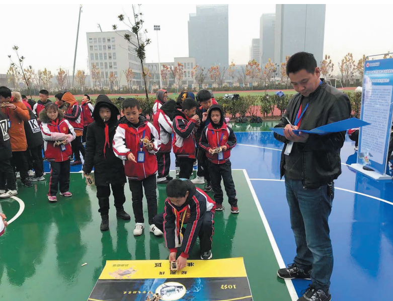
近日,第二十七届江苏省青少年科技模型大赛盐城市选拔赛(响水县分赛点)在双语实验学校举行,全校100余名学生上演了一场科技创新大比拼,共同感受科技带来的别样魅力。图为比赛现场。

重抓营商环境优化。加强对民营企业的沟通联系和精准服务,把企业打造成“统战之家”,把民营企业作为反映情况、献计献策、提出建议的有效渠道,及时听取他们的意见建议。推动“亲”“清”政商关系构建,通过这一平台,将惠企政策及时传达给企业,将企业的诉求及时反馈给政府职能部门,为民营企业创新发展和统战成员创新创业、成长成才创造良好环境。帮助统战成员在解决问题、维护合法权益上进行沟通和协调,强化服务理念,切实提高工作实效,为推动民营经济高质量发展发挥统战作用、作出统战贡献。