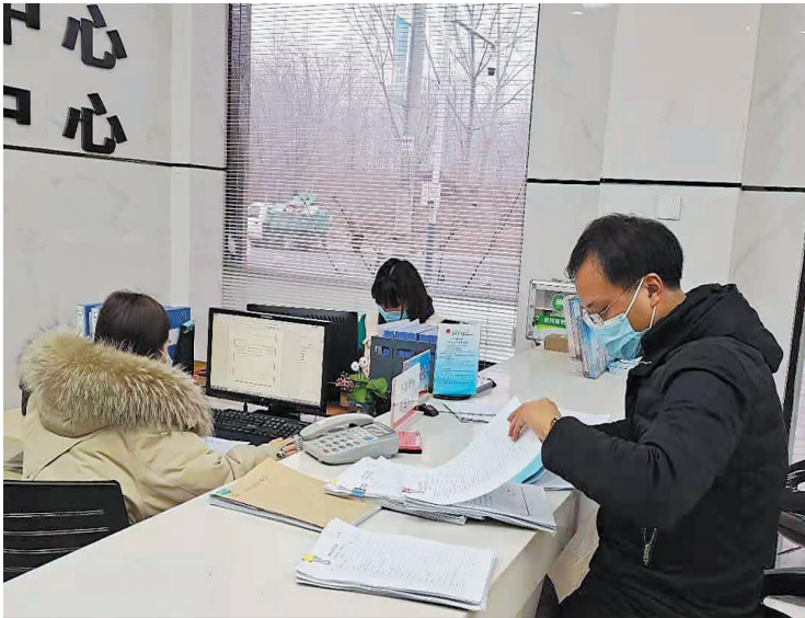
县公共法律服务中心是集多项司法行政职能为一体的“窗口化”服务平台，让广大群众享受到集社会性、专业性、便民性为一体的“一站式”法律服务。图为窗口工作人员为群众办理业务。

由于停车位的紧缺，很多车紧靠着路边来停，但为了不影响交通，都选择了车体一半在马路台阶之上，一半在马路台阶之下，有的甚至停在马路沿上，殊不知这样的停车方式将会对车体造成伤害。高低不平的停车方式，会使得车辆整体车型不断变形，四轮落差过大，对车架